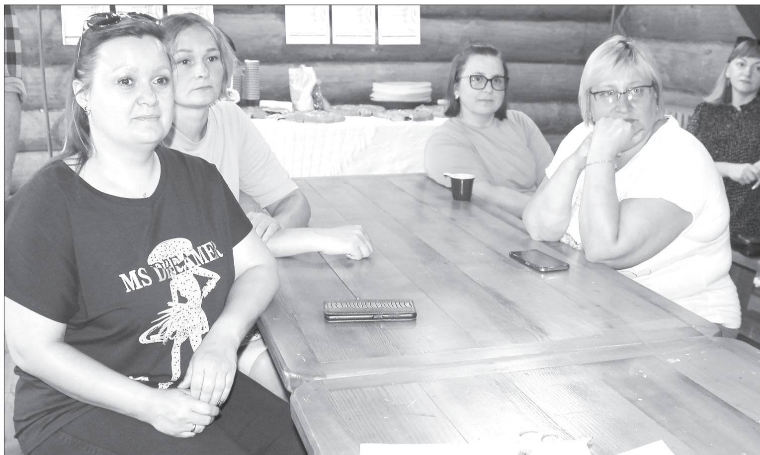
В бережном отношении и заботе нуждаются не только дети и супруг, но и сами женщины, напомнили спикеры

Участницы нового проекта просят продолжить встречи