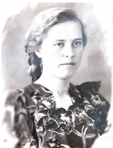
Такой запомнили свою учительницу ученики вечерней школы

Первые шаги в профессии были особенно волнительными. По распределению молодая выпускница попала в Омутинскую вечернюю школу. Здесь ее ждали первые серьезные испытания: ученики вдвое старше своей учительницы. Это были взрослые люди, бывшие фронтовики, которые пришли за