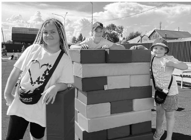
Развлечения с пользой для здоровья. Специалисты Детско-юношеской спортивной школы организовали для юных жителей округа увлекательные игры

еды провели мастер-класс по изготовлению сувениров для земляков - участников специальной военной операции, а юнармейцы увлекли посетителей познавательным патриотическим квестом.