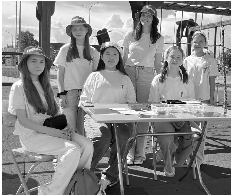
Активисты Движения Первых за мастер-классом по изготовлению праздничных открыток в честь юбилея округа. Каждый участник вложил частичку тепла в поздравление для родного муниципалитета

Общественное движение «Движение Первых» представило сразу несколько тематических направлений - от науки до патриотического воспитания. Участники научного клуба поразили гостей зрелищными опытами и рассказами о собственных исследованиях, юные краев-