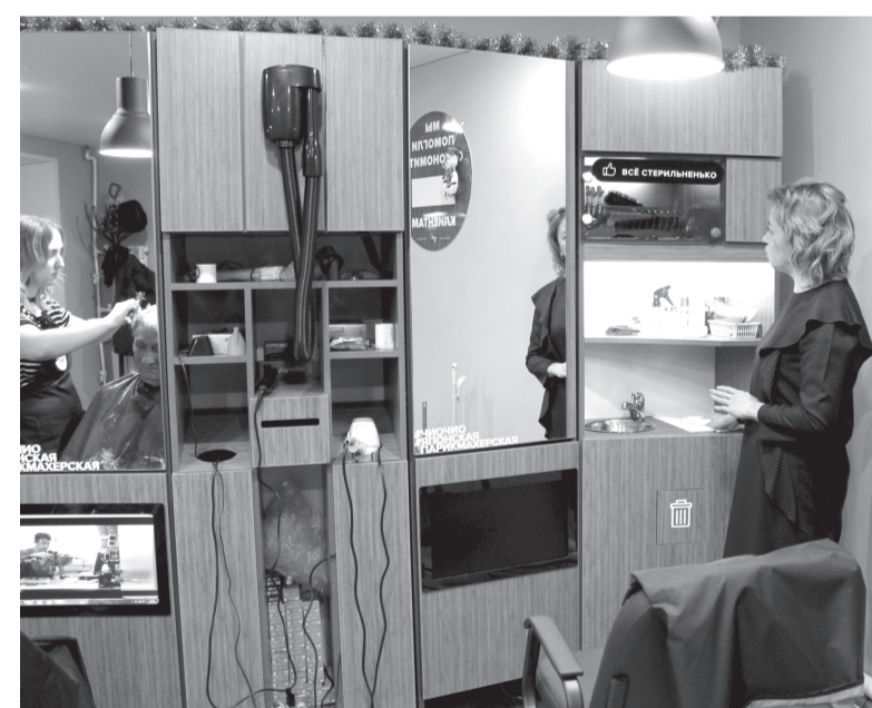
Многофункциональный шкаф с мойкой и пылесосом, стерилизационной камерой

Кстати, такое название бьюти-точка получила в связи с тем, что представляет сеть японских экспресс-парикмахерских – одну из крупнейших в России, преимуществами которой являются быстрота и низкая цена стрижки. В Тюмени уже семь таких парикмахерских, работающих по франшизе. У нас в Тобольске ре-