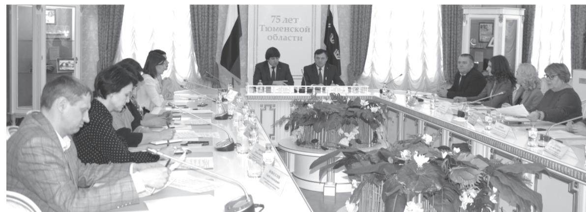
Тобольки и ишимцы за круглым столом

Но главное уже сделано – мост дружбы проложен. Объединил нас знаменитый земляк – П.П. Ершов. Совместными усилиями будет разработан туристический маршрут «Дорогами Конька-Горбунка», в рамках 205-летия со дня рождения П.П. Ершова пройдут дни Ишима в Тобольске и дни Тобольска в Ишиме, будет организован мотопробег «Тобольск – Ишим – Тобольск», на масленичные гуляния и в дни городов произойдёт обмен творческими делегациями, будет проведён ряд совместных спортивно-физкультурных мероприятий и т. д.