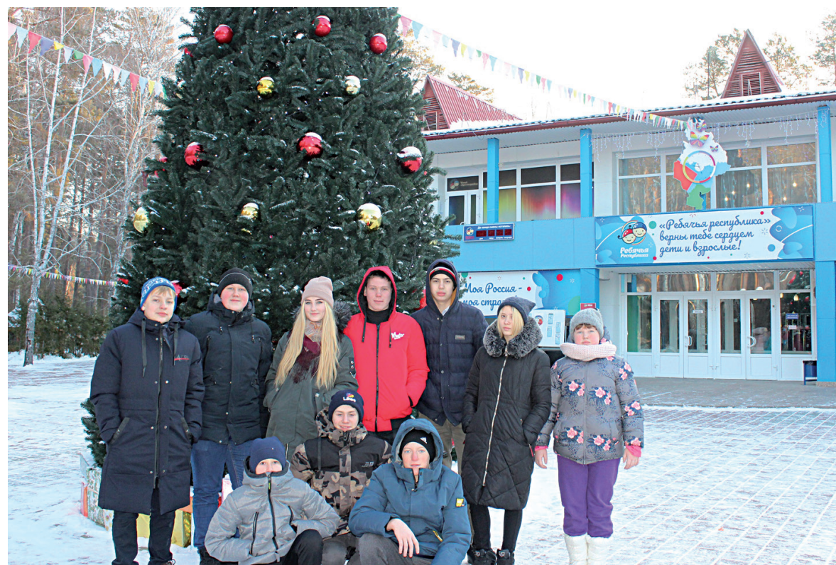
Помечтаем у ёлки: чтобы всё было хорошо в 2021-м

Ребята провели два незабываемых дня в детском образовательно-оздоровительном центре «Ребятчья республика», где их ждала насыщенная развлекательная программа. Здесь каждая минутка была на счету. На прикладных мастер-классах мальчишки и девчонки своими