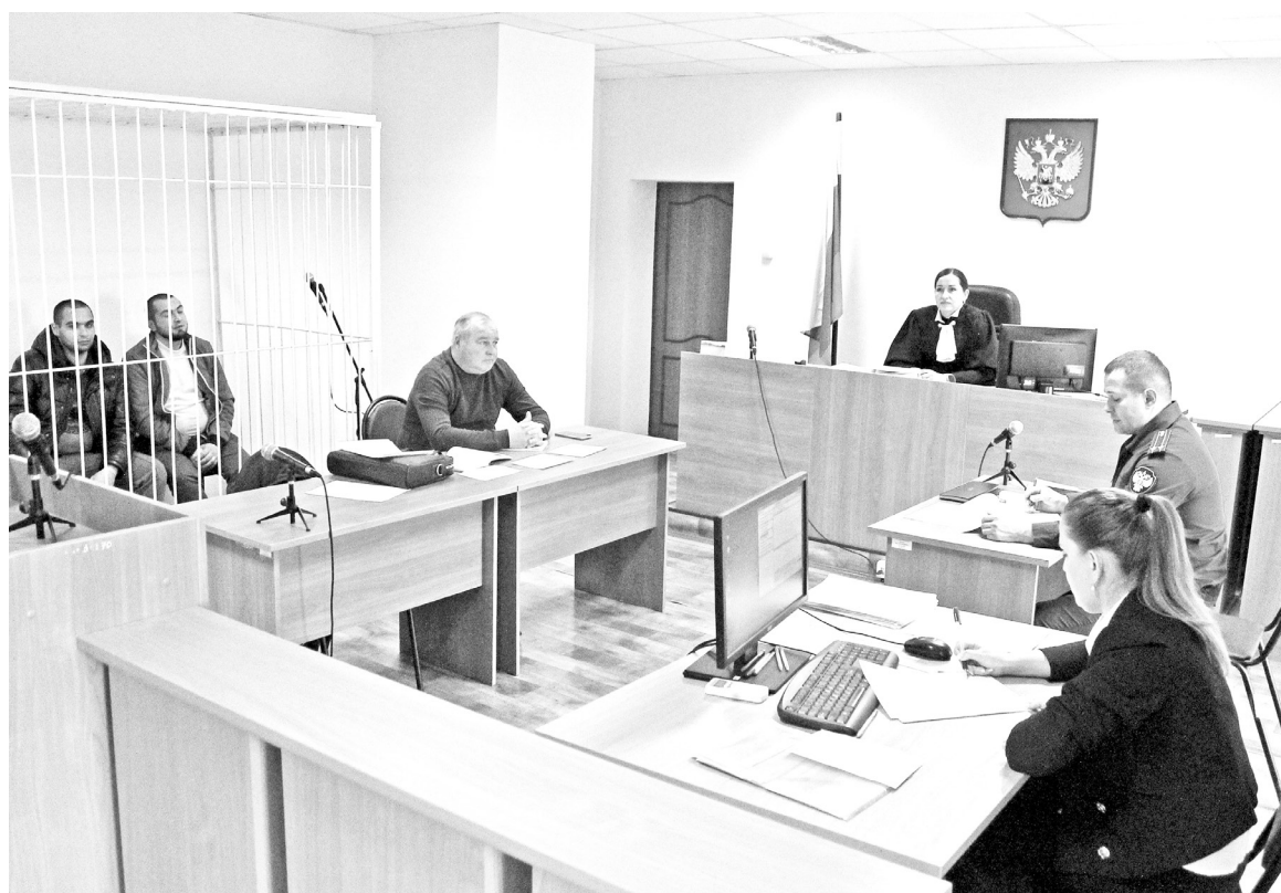
В зале суда.