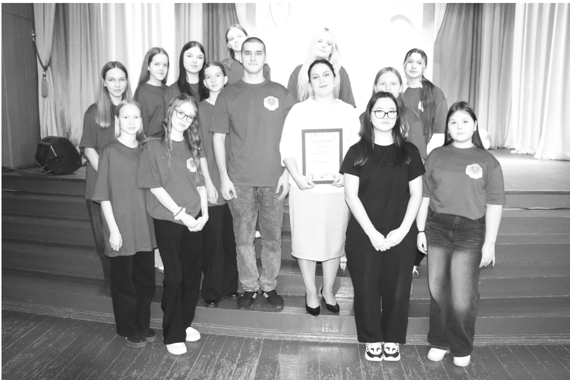
|| «Данко» стал победителем в номинации «Волонтерский отряд».