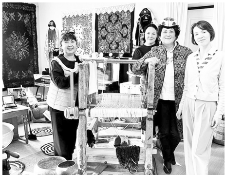
|| Фото из архива Зулейхи Алишевой