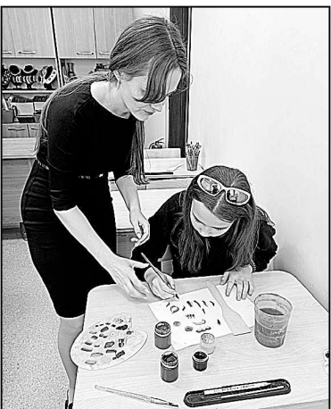
На занятии по кармацкой росписи.

В ДШИ «Мечта» расписали в стиле кармацкой росписи музыкальные инструменты (балалайки) для народного ансамбля, а к лету планируют организовать первую выставку ученических работ.