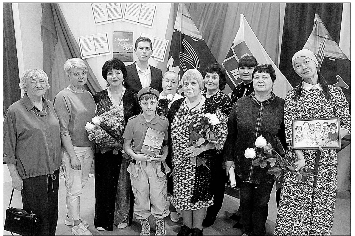
Участники презентации сборника.