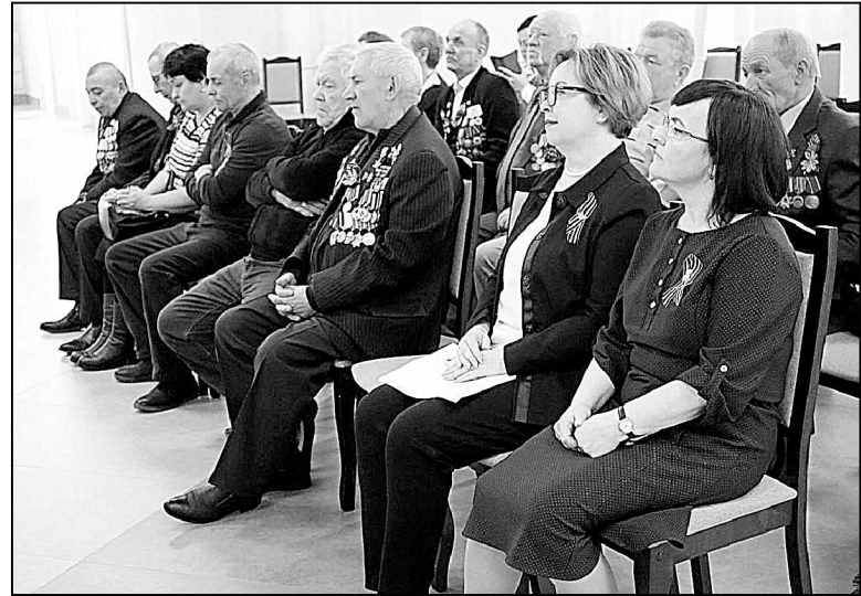
Участники встречи в ЦКиД «Вернисаж».