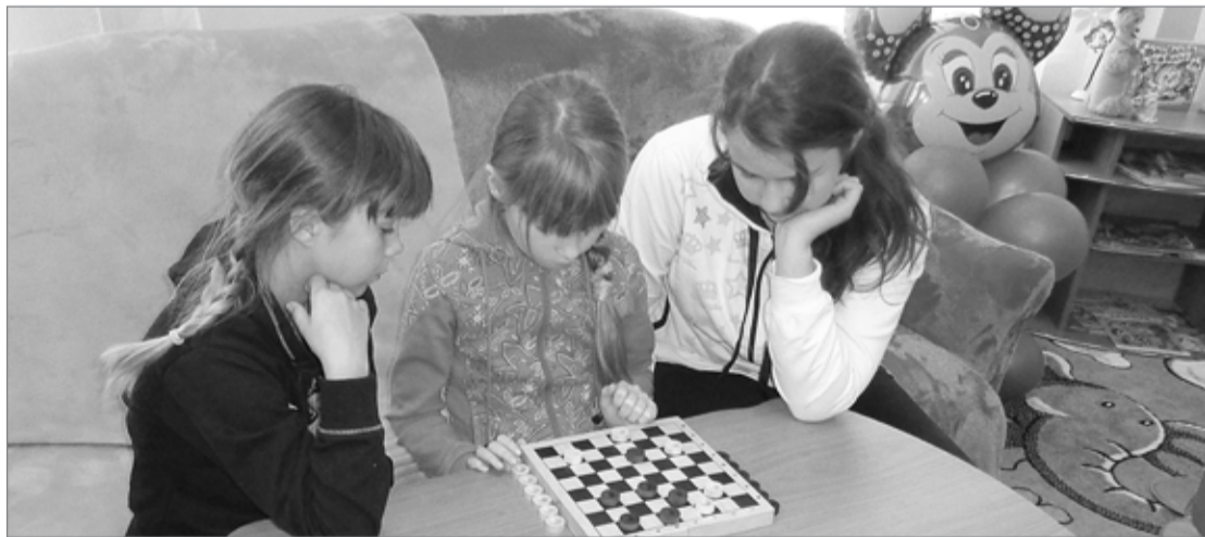
Детям в Боровлянской библиотеке не скучно

В таком небольшом селе, как наша Боровлянка, библиотека не просто книжный храм, где время от времени можно что-нибудь почитать. Это центр культуры, воспитания, где открыта дорога в мир литературы и искусства. А начинается этот путь в раннем детстве. Библиотека призвана быть проводником, а вот какой ей быть – зависит от нас самих.