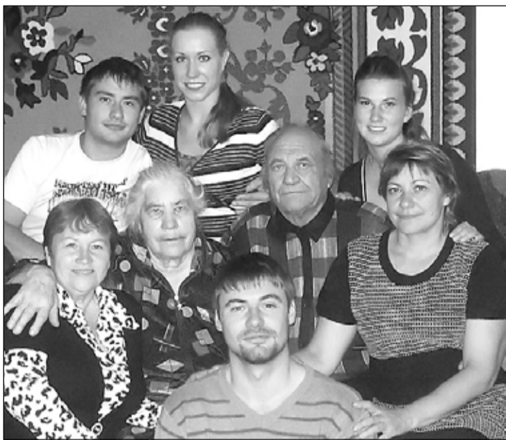
В кругу родных