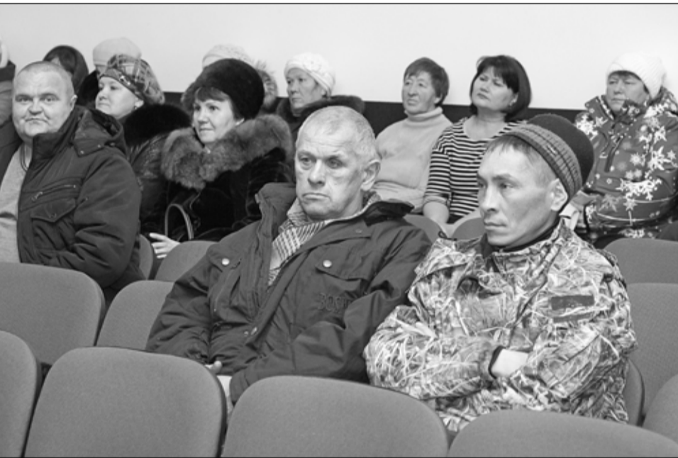
На сходе всю информацию малышницы слушали внимательно

Тема строительства дорог остаётся актуальной на Малышенской территории, несмотря на то, что эта работа ведётся планомерно. Нынче «одели» в твёрдое покрытие 630 метров дороги по улице Комарова.