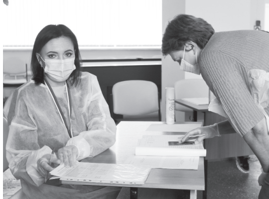
Выбор делают жители посёлка строителей