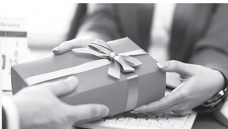
За получение подарка госслужащий может быть привлечён к ответственности – дисциплинарной, административной, уголовной