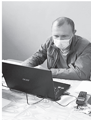
Ведётся электронное заполнение реестров