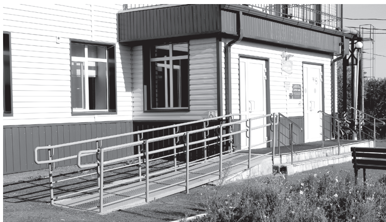
В Детско-юношеской спортивной школе «Кристалл» в рамках программы «Доступная среда» сделана входная группа

О домах культуры говорим более подробно. На сегодня в Лесновском ДК сделаны уличная бегущая дорожка, пандусы – телескопический и металлический с антискользящим покрытием, звонок вызова помощи, тактильные таблички с шрифтом Брайля – в общей сложности более двадцати технических средств и элементов доступности. А в рамках капитального ремонта Лабинского ДК предусмотрено более тридцати позиций, включая пандус, информационную вывеску со шрифтом Брайля, кнопку вызова, портативную индукци-