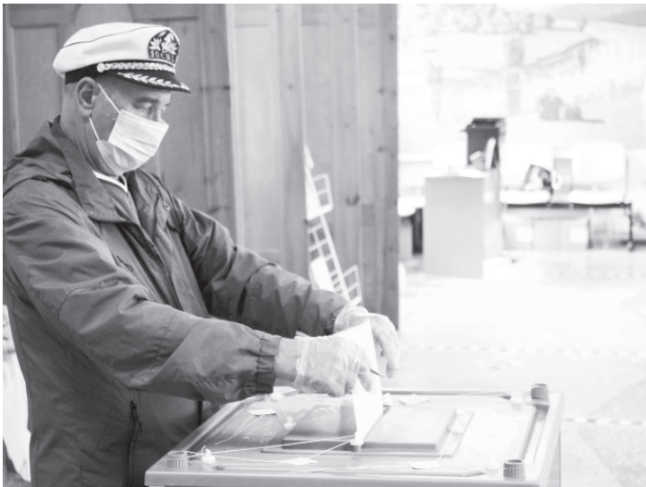
Последний штрих – опустить бюллетень