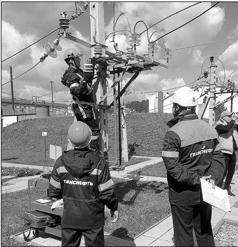
Соревнования на одной из конкурсных площадок по специальности электромонтер.