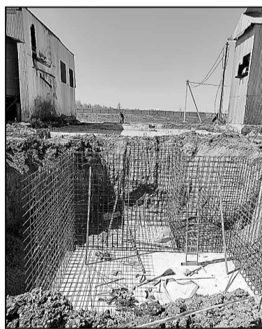
На месте старой сушилки строится новая.

каждой получают более 9000 килограммов молока, в то время как в среднем по району этот показатель 7400.