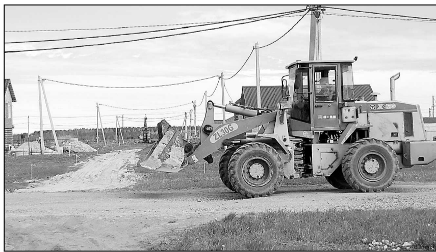
Перекресток улиц Муллашинская и 95-летия Тюменского района. Первая оденется в щебень, на второй ляжет асфальт.

Всего же в 2024-м году здесь будет построено 19 километров дорог,