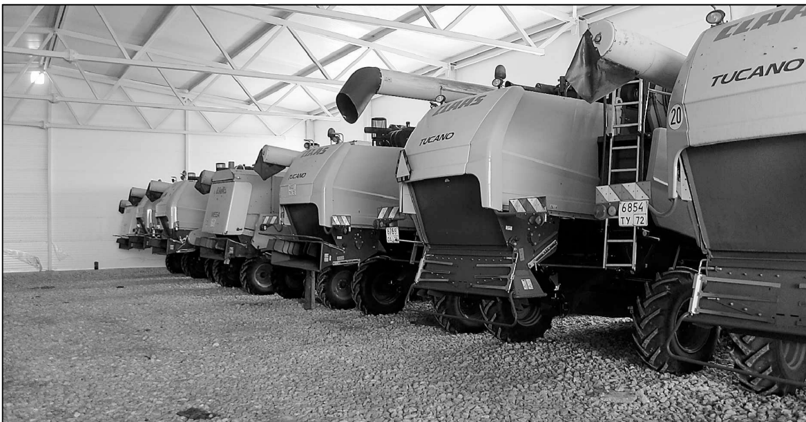
Дорогостоящая техника «Успенского» хранится под надежной крышей.