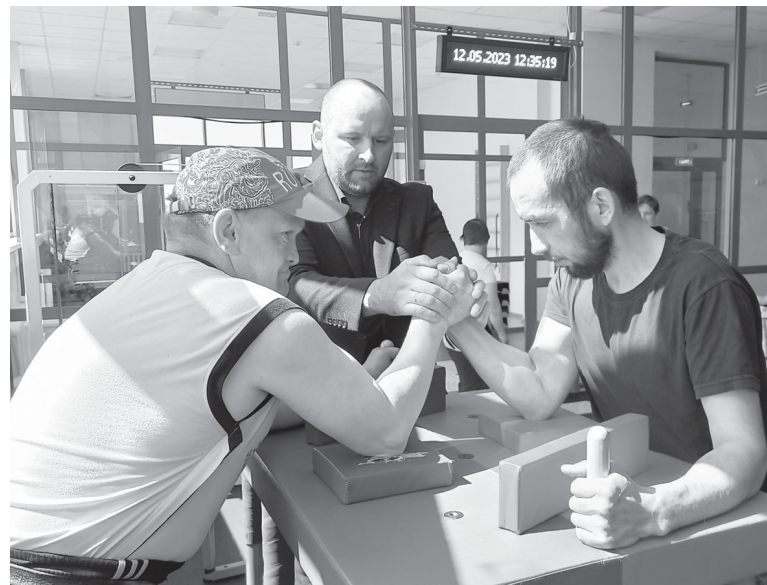
Соревнования по армрестлингу