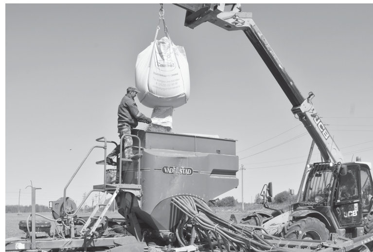
Загрузка семян в бункер посевного комплекса

«В отличие от 2022 года, когда из зерновых культур сеялась пшеница, в нынешнем году клин яровых зерновых представлен ячменём и овсом по заказу наших животноводов», – говорит главный