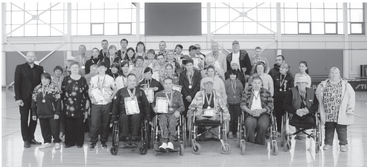
Победители и призёры Паралимпийских игр

Алина КАТКОВА