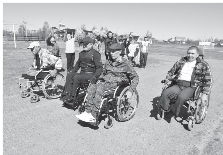
Забег на инвалидных колясках