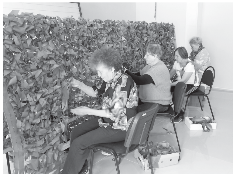
Готовится ещё одна сеть для фронта

изводстве» женщины всех возрастов – приходят в удобные для себя часы, в зависимости от графика работы и домашних дел. Есть те, кто плетёт сети в течение целого дня. При этом все с радостью вникают в новое для себя дело. Одни кроют, другие вяжут, третьи навязывают полоски ткани защитного цвета. Отметим, что маскировочные сети создаются из лёгкой синтетической ткани «Спанбонд» – непромокаемой и доступной по цене, расцветка которой хорошо скрывает военные позиции.