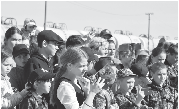
Зрители концерта «Весна Победы»