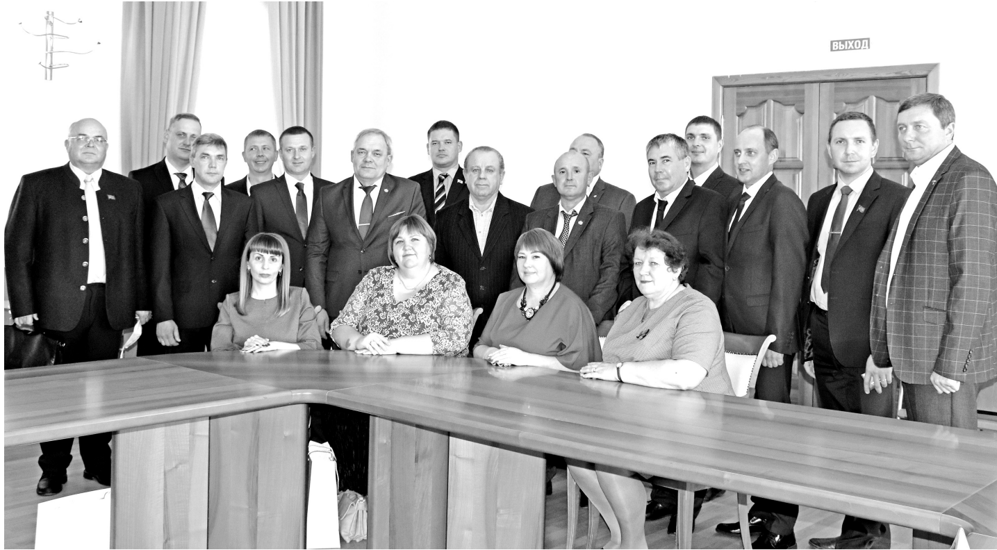
• Дума Заводоуковского городского округа седьмого созыва работает четвёртый год.

В 1994 году в Заводоуковске был избран новый представительный орган местного самоуправления – дума города и района