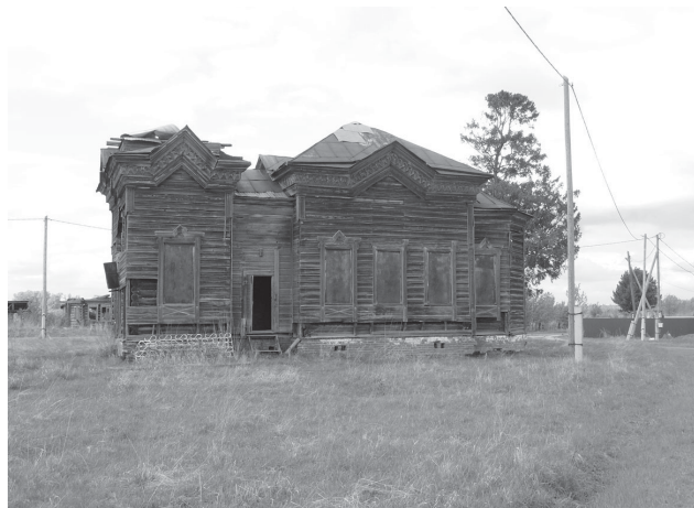
Первым делом – воссоздание прихода, а уже затем – ремонт храма