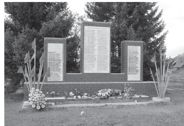
Памятник павшим землякам в Староалександровке ждет ремонт. Но с меньшими затратами

«Нисколько не умаляю вашего труда, как автора, вижу,