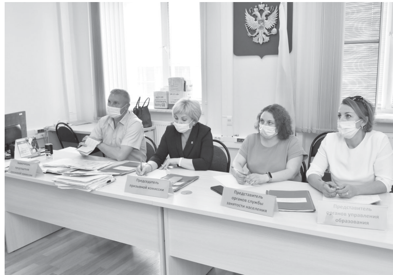
Члены призывной комиссии внимательно знакомятся с каждым из будущих солдат

Традиционно к месту несения службы призывников доставят на железнодорожном транспорте. У выпускников средних и высших учебных заведений есть возможность, минуя срочную службу, сразу же заключить контракт. Такой вариант имеет ряд преимуществ