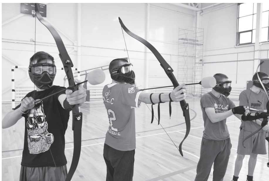
Такой вид лучного боя безопасен и азартен одновременно

«Слева заходи!», «Подкидывай стрелы!», «Гони его в угол!» – эти и другие речевки-кричалки можно было услышать субботним утром, 15 мая, в спорткомплексе «Ярково». Именно здесь представители АНО «Центр развития тактических игр и видов спорта «Федерация лучного боя» провели областной турнир по лучному бою для команд из Яровского, Тюменского и Юргинского районов.