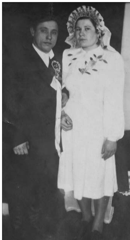
• На свадебном торжестве молодые Генергарды были в традиционных немецких нарядах.