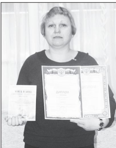
Работы Людмилы Фоменко на конференции были отмечены дважды.