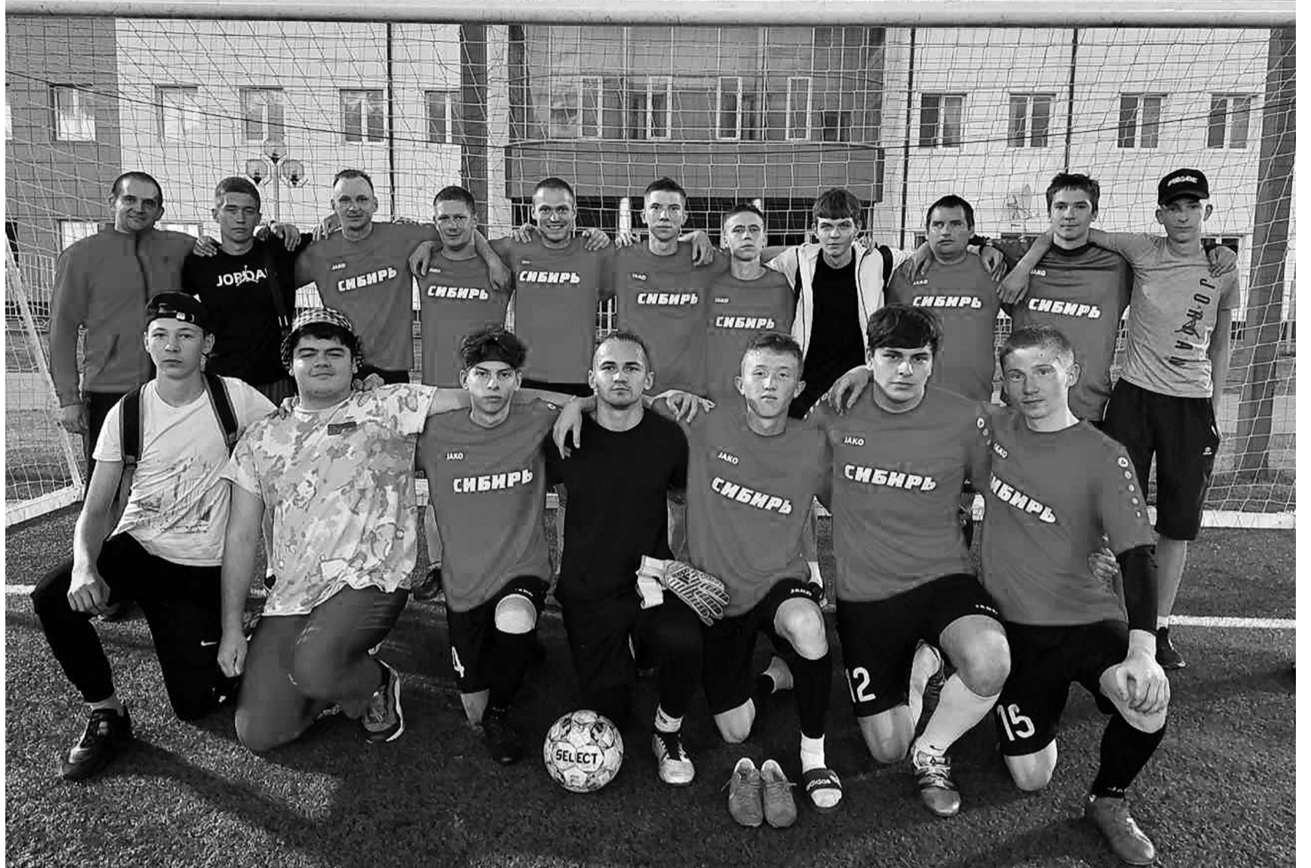
На снимке: сорокинская команда "Сибирь" вместе со своими верными болельщиками