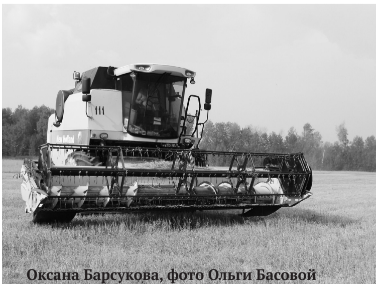
Оксана Барсукова

По состоянию на 25 августа в районе шесть предприятий приступили к обмолоту зерновых.