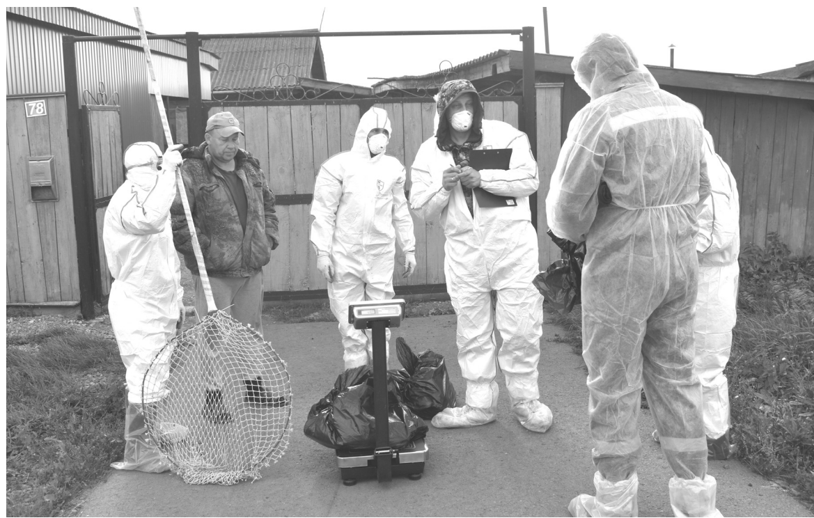
Только за январь грипп птиц зарегистрирован в трех регионах России

Основным источником вируса в природе являются водоплавающие птицы, которые переносят вирус в кишечнике и выделяют его в окружающую среду со слюной и пометом. У диких уток вирус гриппа размножается главным образом в клетках, выстила-