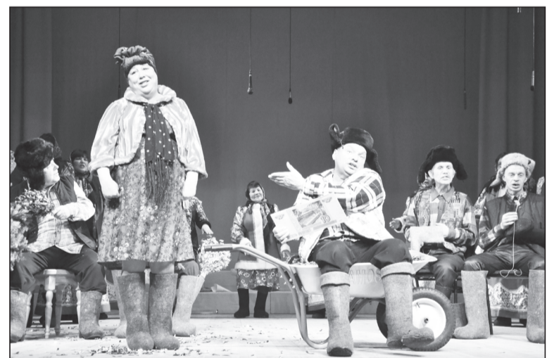
Повеселили публику липихинские вокалисты, спев про мужиков, которых надо любить.

Остальные участники тоже не остались без наград. Каждый коллектив отметили в различных