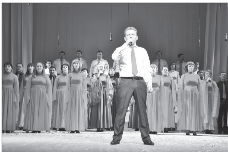
Хор администрации района патриотично исполнил песню о России.

Выступления творческих коллективов стали настоящим красочным шоу. За этим стояла большая ежедневная многоча-