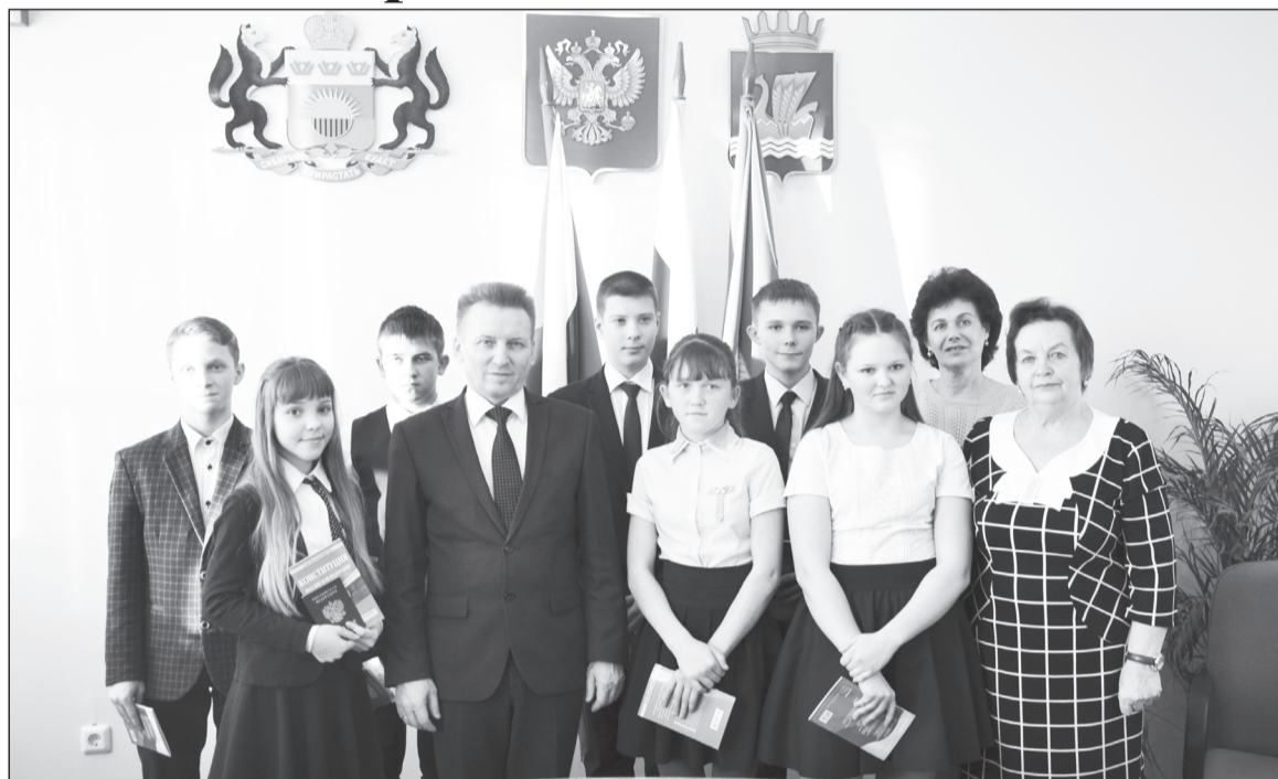
Фото на память в завершении церемонии вручения первых паспортов юным гражданам.