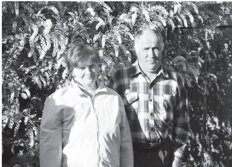
Одна из немногих фотографий в семейном альбоме, где супруги одни