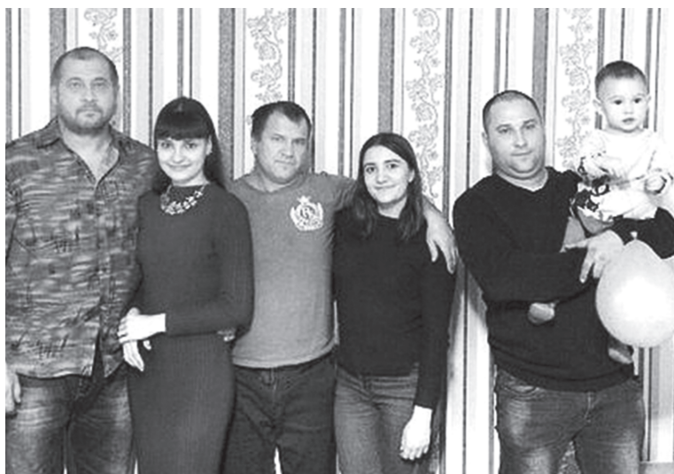
Сыновья Валерий, Евгений и Сергей со своими детьми

Ольга КОНОВАЛОВА