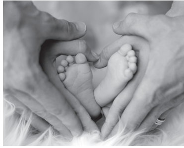
Поддержка семьи – важная государственная задача

расходовавших материнский капитал, также проиндексированы с этого месяца.