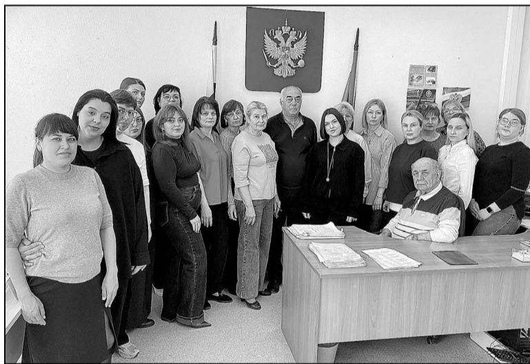
Коллектив работников военкомата.

- Взаимодействие с военным комиссариатом осуществляется в рамках тесного сотрудничества. Деятельность военного комиссариата невозможна без активного участия органов местного самоуправления, сотрудников подведомственных учреждений и территориальных управлений. Основой нашей совместной работы являются принципы взаимопомощи и взаимопонимания между указанными структурами, что способствует эффективной реализации государственных задач. Мы обеспечиваем координацию действий и оказываем всестороннюю поддержку военкомату как в организационном, так и в техническом аспектах. В знак признания заслуг лучших сотрудников военного комиссариата им предоставляются награды, поощряется их профессиональное развитие. Мы всегда за то, чтобы говорить людям слова благодарности за качественное выполнение работы.