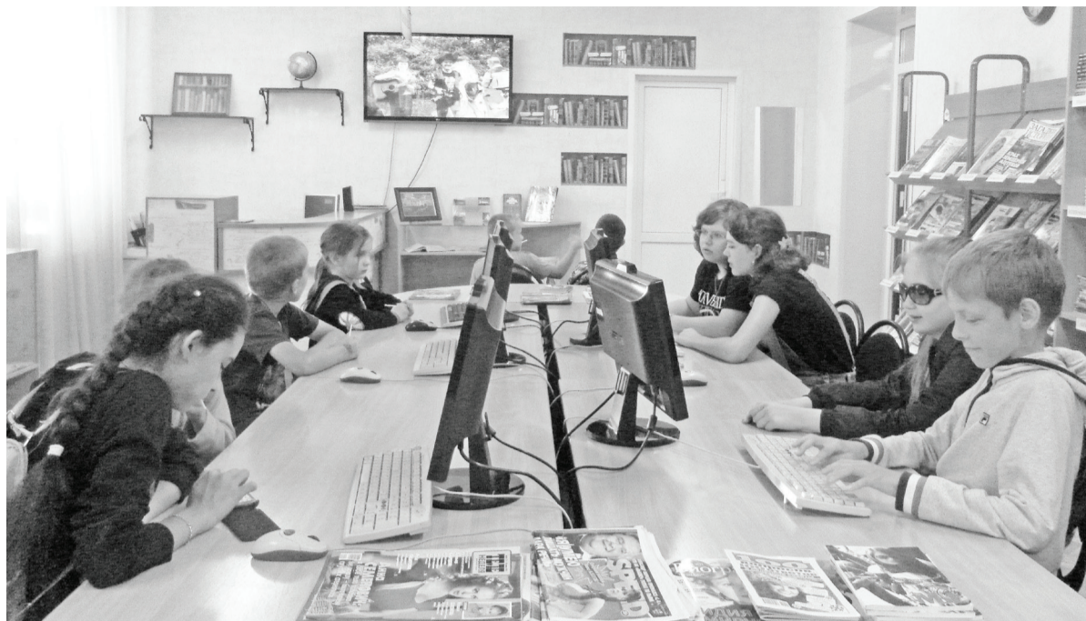
«Дело было вечером, нам заняться было чем». Вечер поэзии в центральной районной библиотеке.

Также в 19 сельских библиотеках были разработаны свои