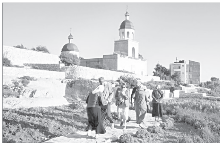
Русский участок в Хевроне - здесь хотя бы раз в жизни стоит побывать каждому россиянину

Представьте себе, что двести лет назад русские паломники испытывали на святой земле крайнюю нужду и бедность. У россиян здесь не было ни одного русского уголка.