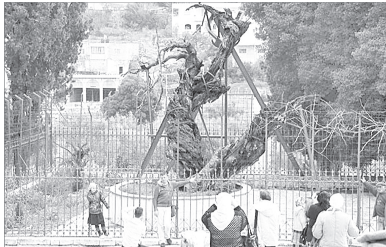
Мамврийский дуб в 2016 году и в конце 19 века

Есть места на земле, где замечательно укрепляется тело, а есть - где удивительным образом укрепляется дух. Для первого хороши пятизвездочные отели на берегах теплых морей и океанов, а для второго - скромные туры паломников по следам уникальных людей и событий.