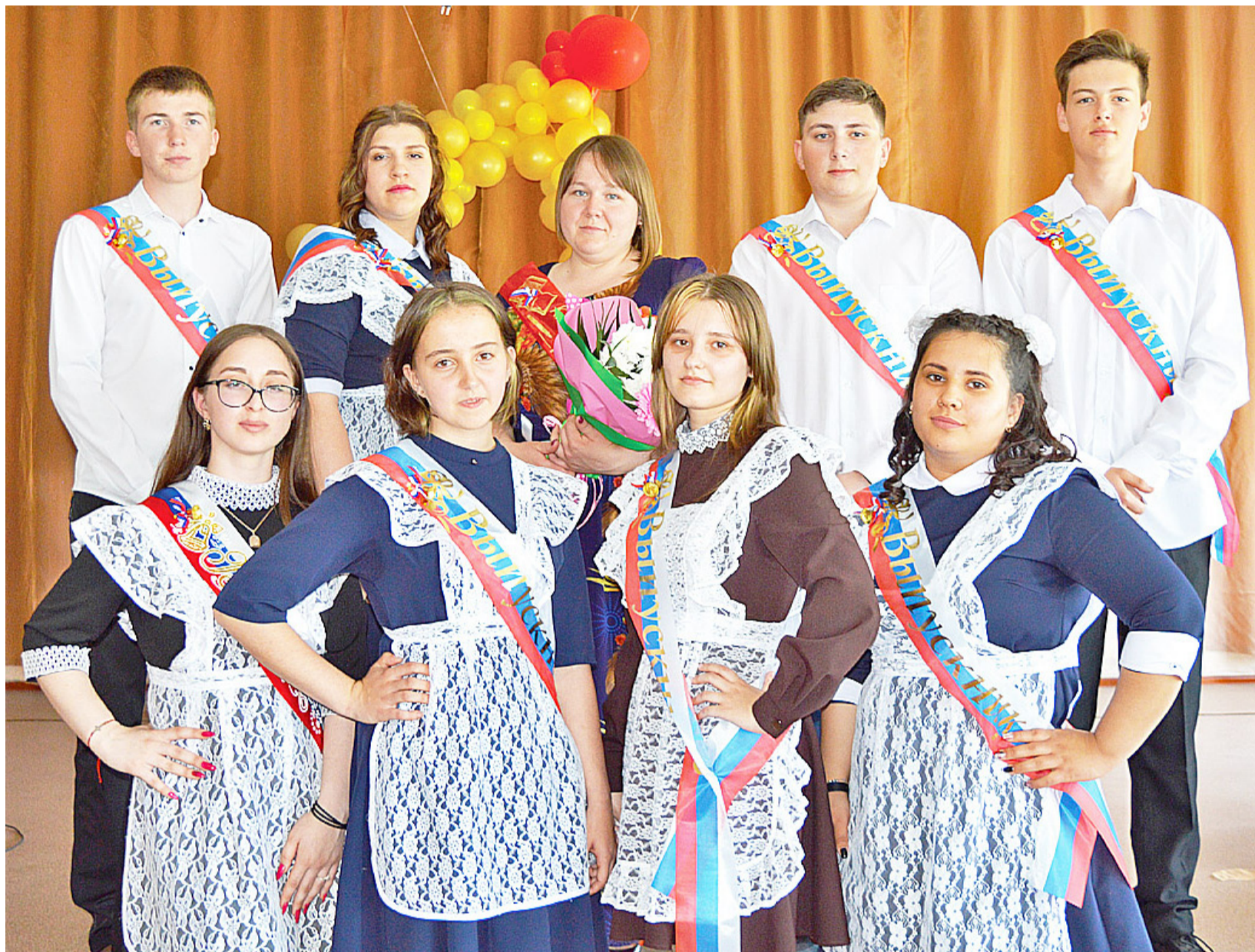
Ребята из Дубынской средней школы, как и всех одиннадцатиклассников, ждут экзамены и новая взрослая жизнь

Волнительный и долгожданный для выпускников всех школ праздник последнего звонка состоялся 21 мая.