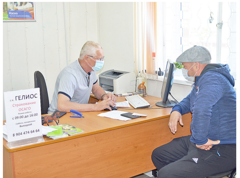
В местном отделении страховой компании «Гелиос» автолюбители могут оформить полис ОСАГО

даже будут и ткани. Очень надеюсь, что люди, приходя в мой магазин, смогут приобрести всё, что им необходимо.