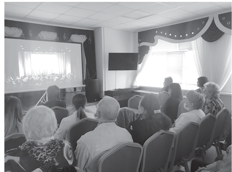
На связи Тюменская государственная филармония

Сеть виртуальных концертных залов, созданная по всей России, позволит значительно