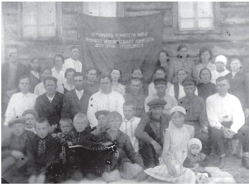
Артель Буденного в годы войны

80 лет назад, 22 июня 1941 года, началась Великая Отечественная война. Все мы знаем, какой ценой далась нам победа на фронтах. Но не меньший героизм проявляли советские люди и в тылу. Самоотверженно трудились, стойко выносили все трудности военного времени. И вместе с тем верили в Победу, воспитывали детей, делали все, чтобы после войны жизнь для всех стала лучше.