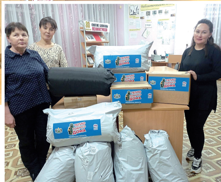
► Тёплый привет из Булашова

В числе активных участников акции «Тепло родного дома» и жители Булашова. В предновогодние дни здесь силами участников художественной самодеятельности был дан благотворительный концерт. На собранные средства совет ветеранов приобрёл спальные мешки, одеяла, влажные по-