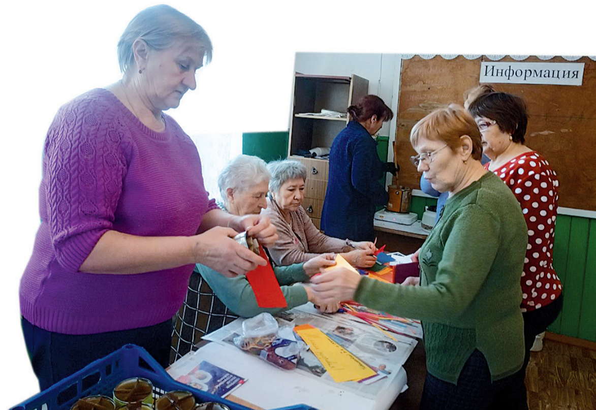
► Кутарбитские добровольцы

Люди откликаются по первому зову. Кто-то приносит банки, кто-то выделяет средства на приобретение сырья, растёт количество желающих помочь в изготовлении свечей. И это очень здорово, ведь общий труд сплачивает и детей, и взрослых. Когда фронт и тыл едины, побеждает справедливость, это доказали своим подвигом наши деды и прадеды!