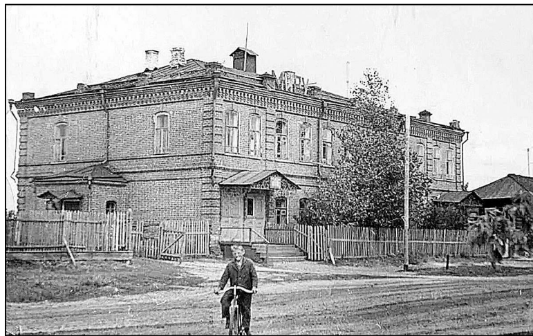
Здание Борковской школы в 40-50-х годах.