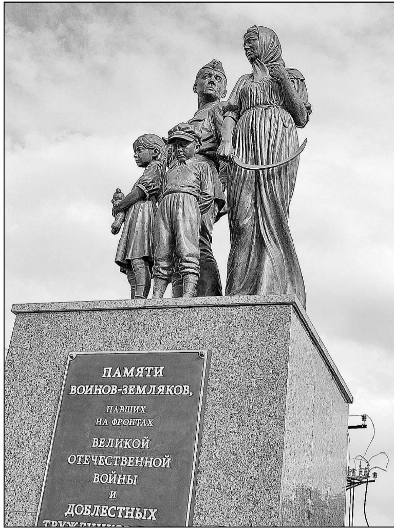
Новый мемориал в Червишево увековечил память земляков.