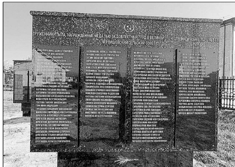
269 фамилий высечены на плитах мемориала.