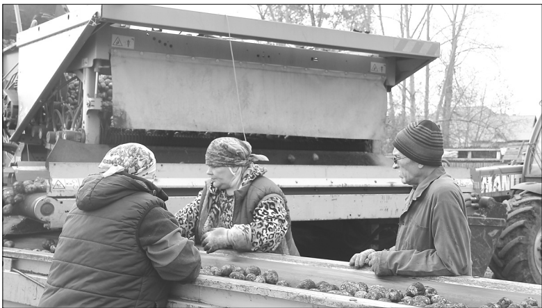
Работа кипит не только в полях, но и на складе

Выращиванием картофеля в производственных масштабах на территории Голышмановского городского округа занимаются два сельхозпредприятия – СПОК «Фермер» и КФХ «Никифорово». Общая площадь посевов картофеля в текущем сезоне 130 гектаров.