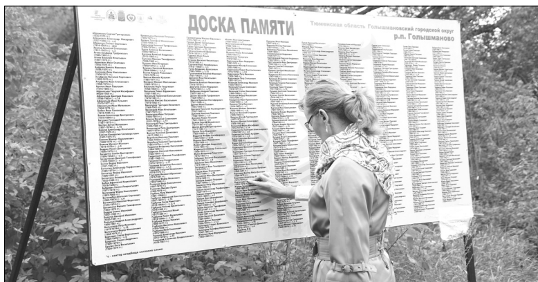
На старом кладбище находятся около 500 захоронений участников ВОВ. Краткие сведения о них – на Доске Памяти