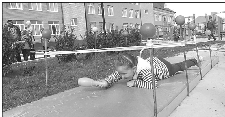
«Боец» отряда уверенно ползёт под «колючей проволокой» с добытым снарядом!

Ветераны-пограничники проводят военно-патриотическую игру для детсадовцев