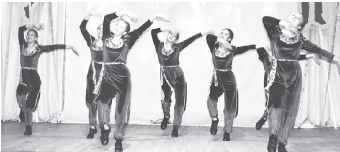
Образцовый хореографический коллектив «Радуница» подарил зрителям зажигательный танец.