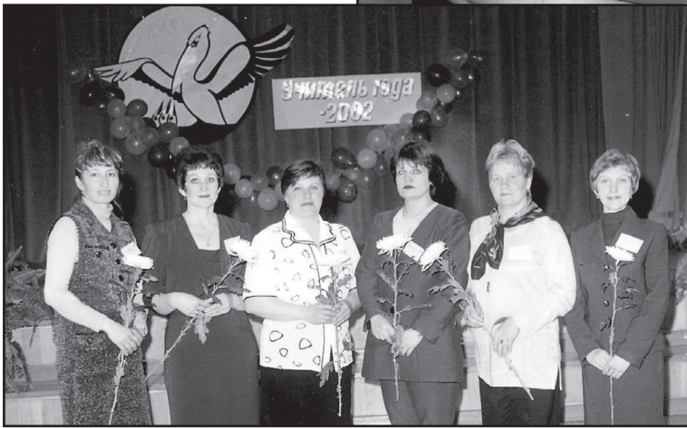
Конкурс профессионального мастерства

Ей предложили перейти в сферу профтехобразования, новую для неё. Мастером в классе швей, начав обучение этой специальности в Юргинском ПУ №49 буквально с нуля. Предстояло найти общий язык с абсолютно другой областью деятельности. Поворотный пункт в жизни. Возможно, без непосредственного общения с руководителем