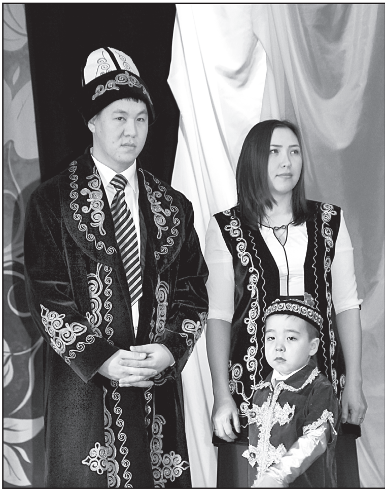
На фестивале-конкурсе молодых национальных семей

– Культура любого народа не может существовать без традиций, которых этот народ придерживался на протяжении всего своего существования. Бережное отношение к традициям и