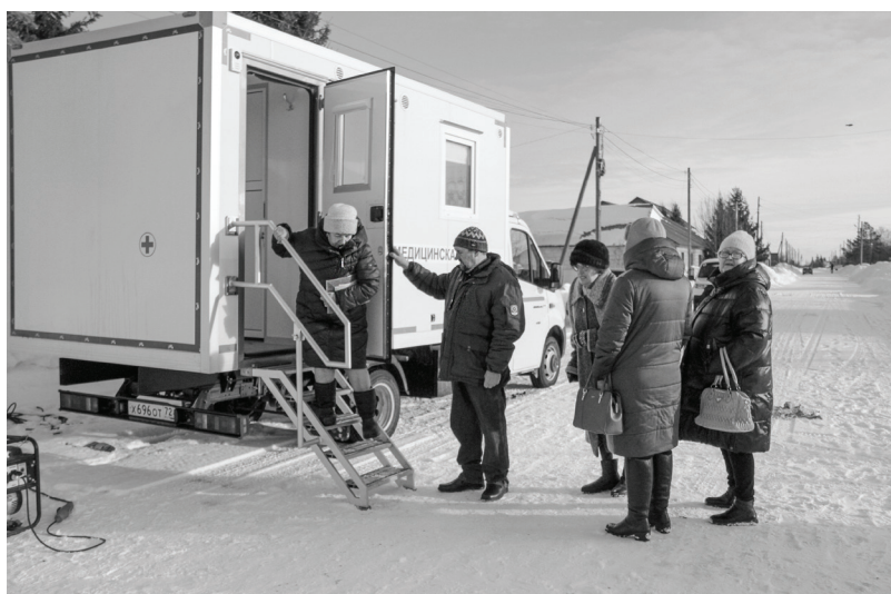
Медицинская помощь становится все ближе сельскому населению. По малым населенным пунктам курсирует ФАП на колесах, оснащенный самым современным диагностическим оборудованием.

– Комплекс оснащен всем необходимым, чтобы оказывать качественную медицинскую помощь, –