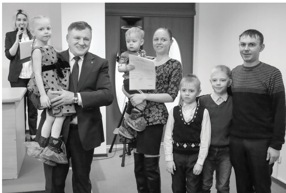
Благодаря господдержке еще 20 семей из Ишима смогут улучшить свои жилищные условия.

– Ишим нужно развивать, для этого в городе созданы все необходимые условия, – подчеркнул Фёдор Шишкин. – В этом году начнется строительство поликлиники на ул. Одоевского. Ежегодно вводятся в эксплуатацию новые многоквартирные дома, большой выбор жилья на вторичном рынке. Начнет-