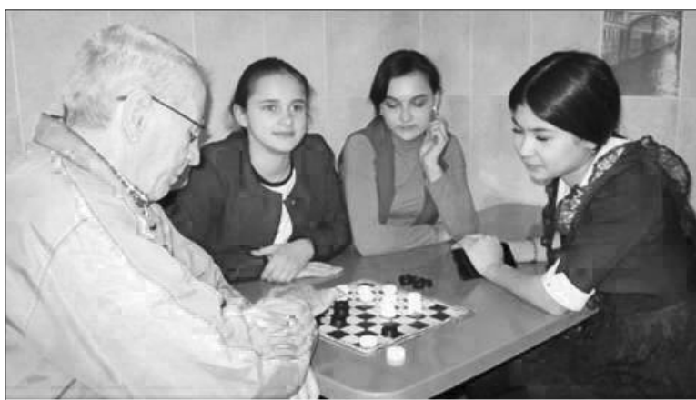
За партией в шашки у учеников и пожилых людей уходит не один час

В очередной раз такие соревнования среди старшекласников, подопечных дома-интерната и волонтеров ветеранской организации