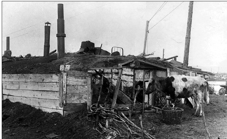
В таких бараках раньше жили люди

Деревни Желтой сегодня нет на карте Бердюжского района. Исчезла деревня, а вместе с ней – целая история. Но есть люди, которые там родились и выросли. Они сохранили теплые воспоминания о своей малой родине и фотографии. И сегодня из рассказов сельчан, архивов и документальных свидетельств мы узнаем о том, какая была исчезнувшая деревня Желтое.