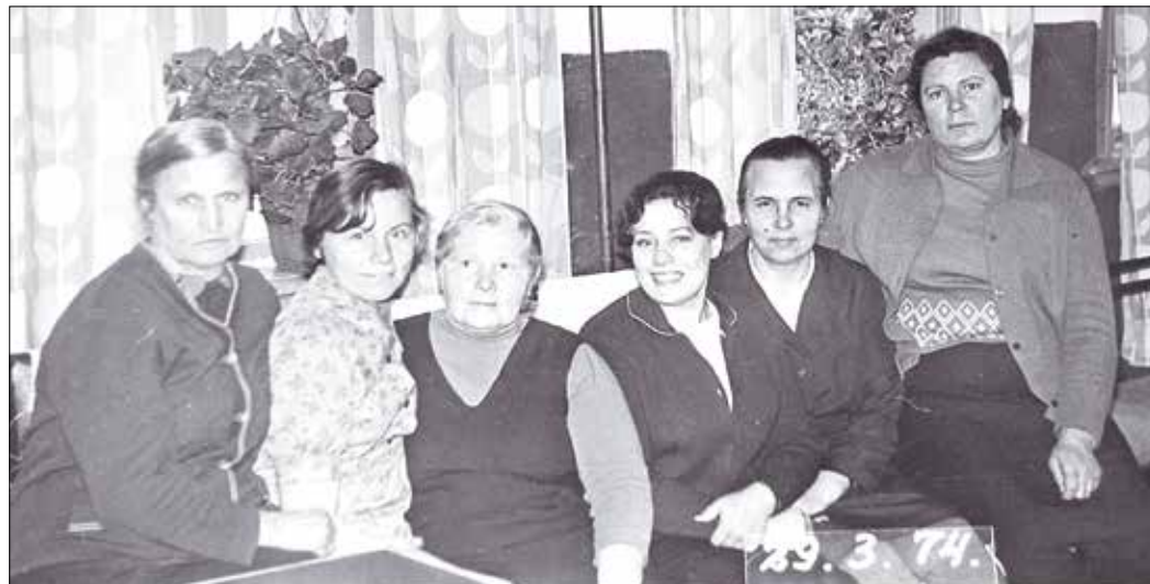
Архив соседствовал с ЗАГСом. И фотографировались все вместе

Любовь АЛЕКСЕЕВА.