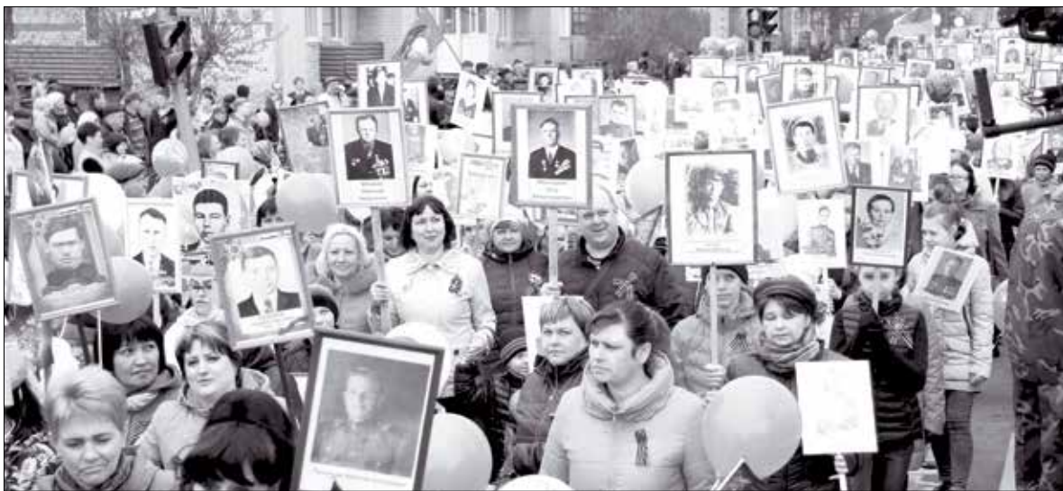
В прошлом году в колонне «Бессмертного полка» прошли более 2000 жителей нашего района с портретами воинов-победителей, нынче их количество увеличится