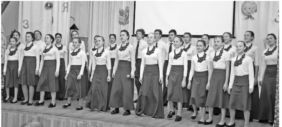
► Хор ВСОШ № 2, 2019 г.