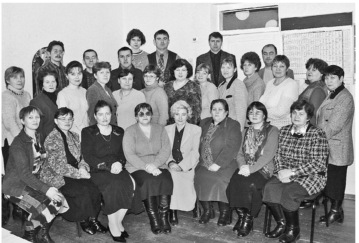
► Коллектив Викуловской школы № 2, 2004 г.