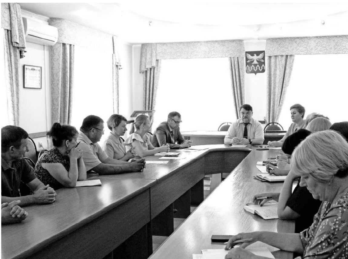
» Во время совещания

В районе растёт число самозанятых граждан. Чаще всего такую форму заработка выбирают те, кто не желает состоять в традиционных трудовых отношениях, но не прочь проявить себя в качестве самостоятельного производителя. Среди жителей популярны разные виды самозанятости, одна из которых – ведение личного подсобного хозяйства.