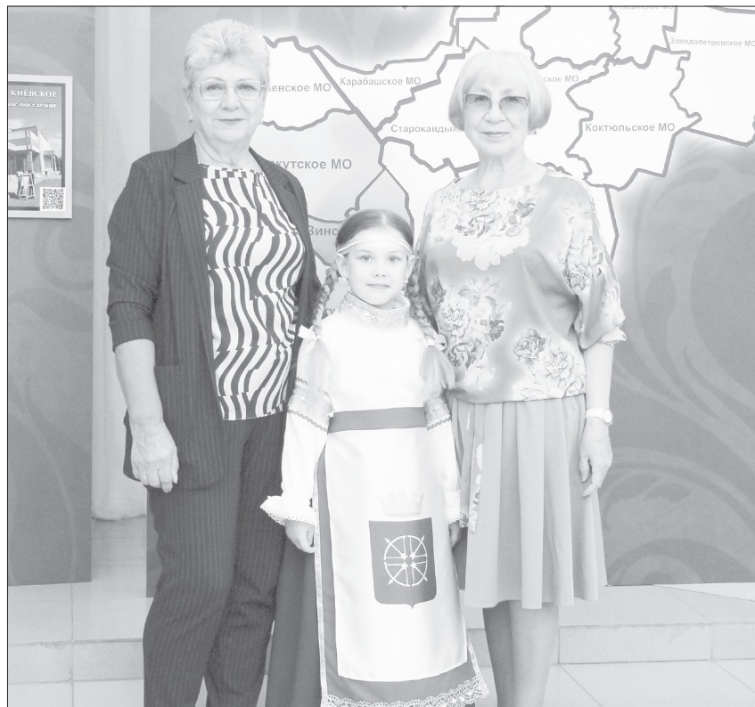
С символом Ялуторовского района - Ярославия - фотографировались все желающие