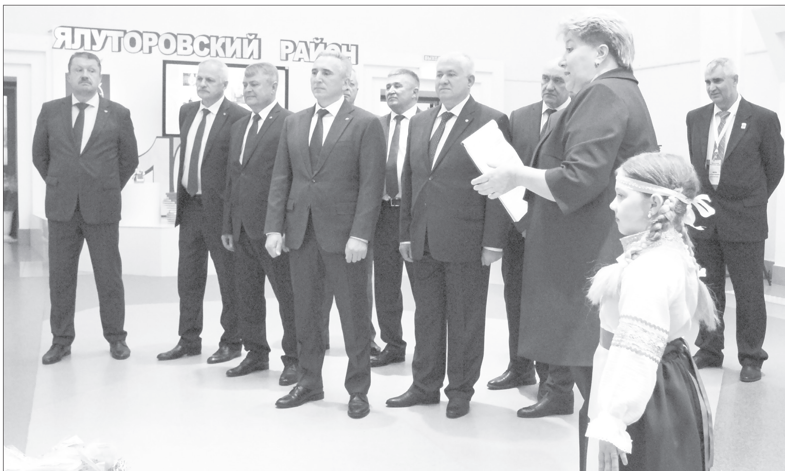
Почётным гостям представили экспозицию с достижениями муниципалитета, которую развернули в холле Дворца культуры