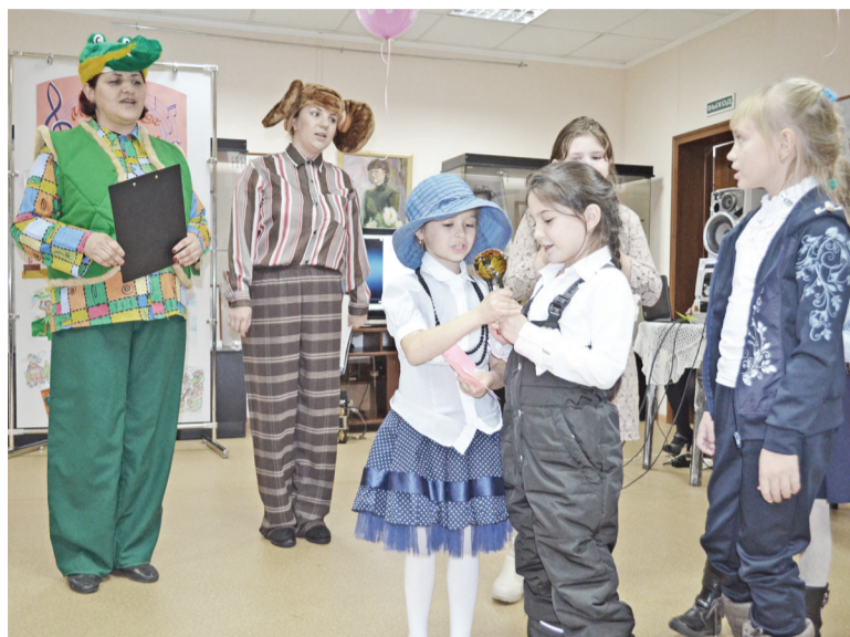
В литературной гостиной дети пообщались с героями мультфильмов.

С 3 по 4 ноября двери культурных учреждений оказались широко распахнутыми для всех, чья жизнь в той или иной мере связана с творчеством. Каждый год культурно-образовательная акция «Ночь искусств» опускается на большие города, районные центры, сёла, объединяя тысячи людей, от самых маленьких граждан до представителей старшего поколения, тех, кто стремится воплотить в жизнь мечты о реализации своего творческого потенциала.