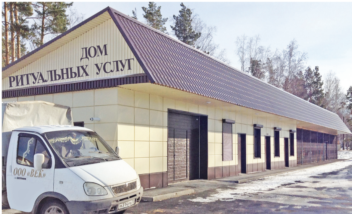
Новое здание Дома ритуальных услуг находится рядом с кладбищем.

По звонку увозим в морг бесплатно. Родственникам остаётся приехать в Дом ритуальных услуг, выбрать всё необходимое и ожидать. Из морга тело доставим по адресу либо (по желанию) в зал прощания, где можно провести отпевание и попрощаться с близким чело-