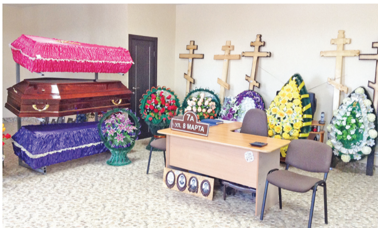
В выставочном зале.