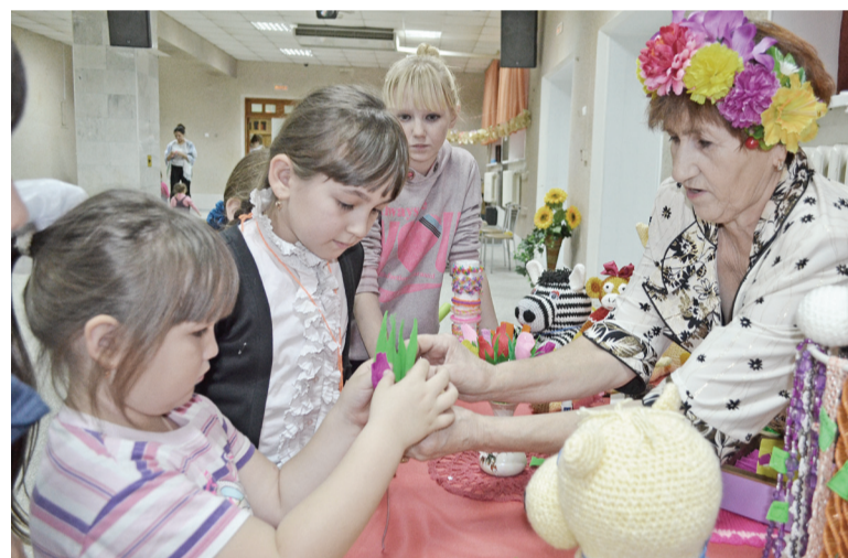
Девочки есть девочки – они за красоту!