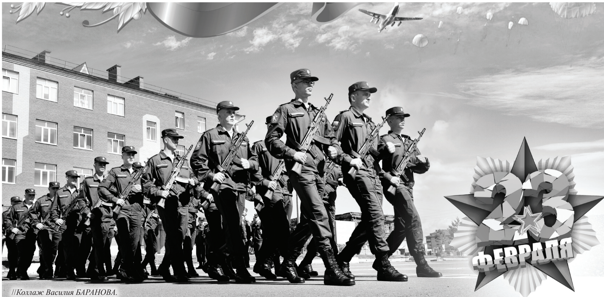
//Коллаж Василия БАРАНОВА.