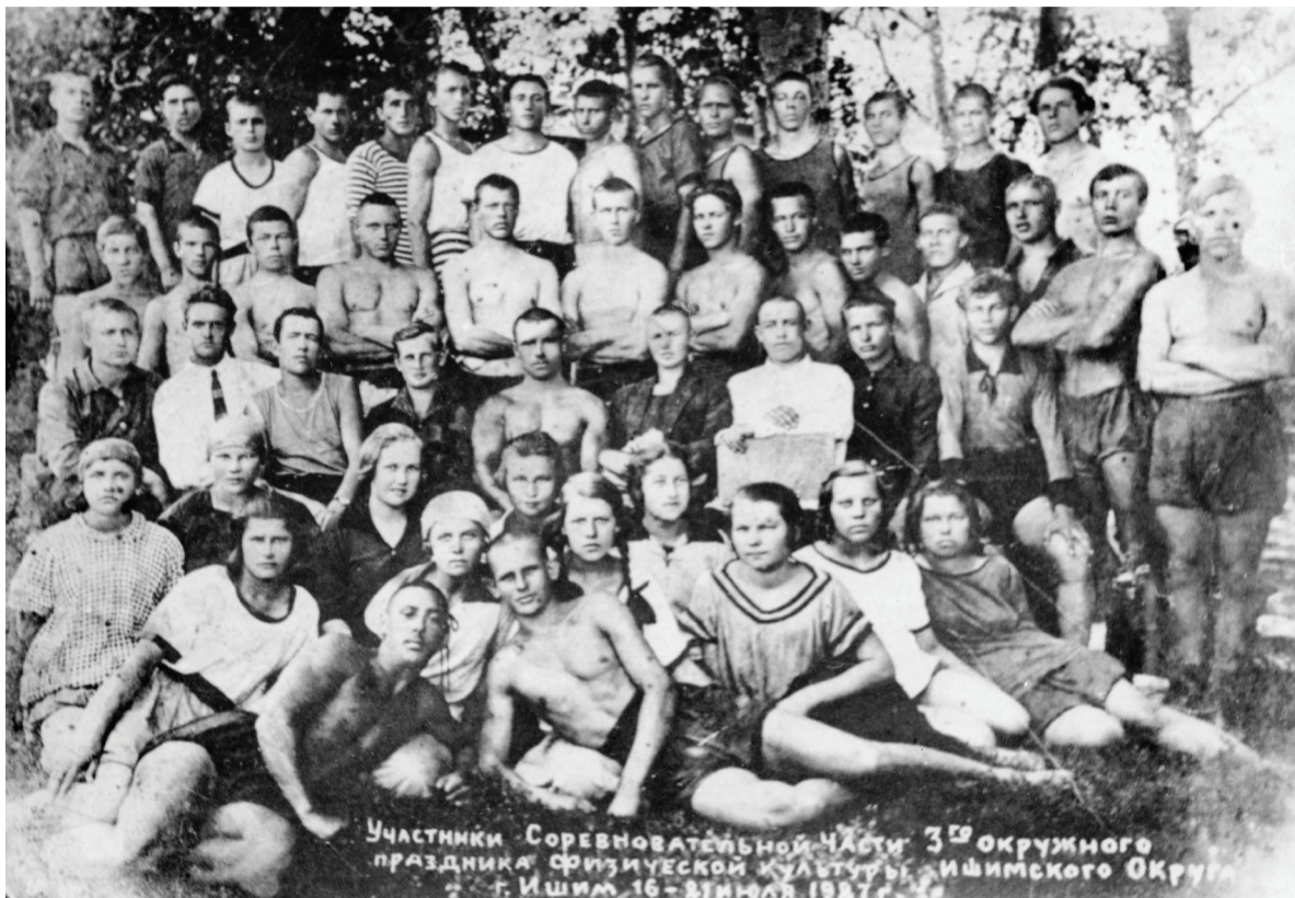
Участники 3-го окружного праздника физической культуры. Ишим, 16–21 июля 1927 г.

Под патронатом окрсовета создавались кружки и спорт-