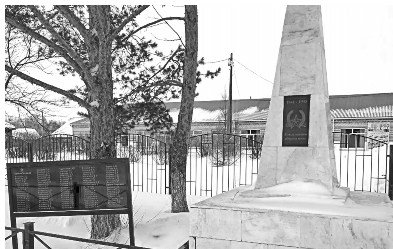
Жители деревни Земляной обеспокоены состоянием памятника участникам Великой Отечественной войны. В этом году его обязательно отремонтируют к 9 Мая

Нерешаемых проблем нет – есть трудные задачи. Например, в деревне Брованова давно ждут газ. Вопрос и ныне поднят на сходе. Заместитель главы округа Олег