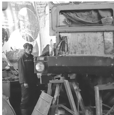
В Малышенском отделении ООО СП «Голышмановское» в отапливаемых мастерских с осени ведётся ремонт тракторов и прицепных механизмов

Подготовила Наталья ГЛАДКОВСКАЯ