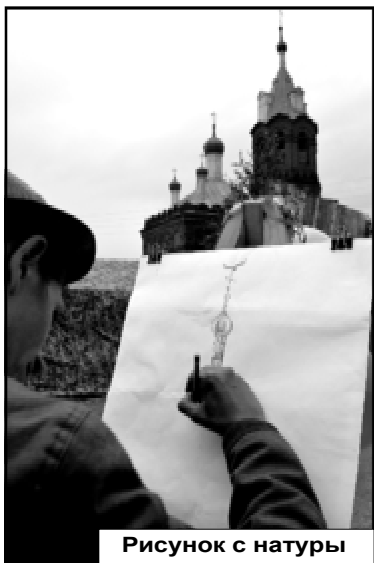
Рисунок с натуры