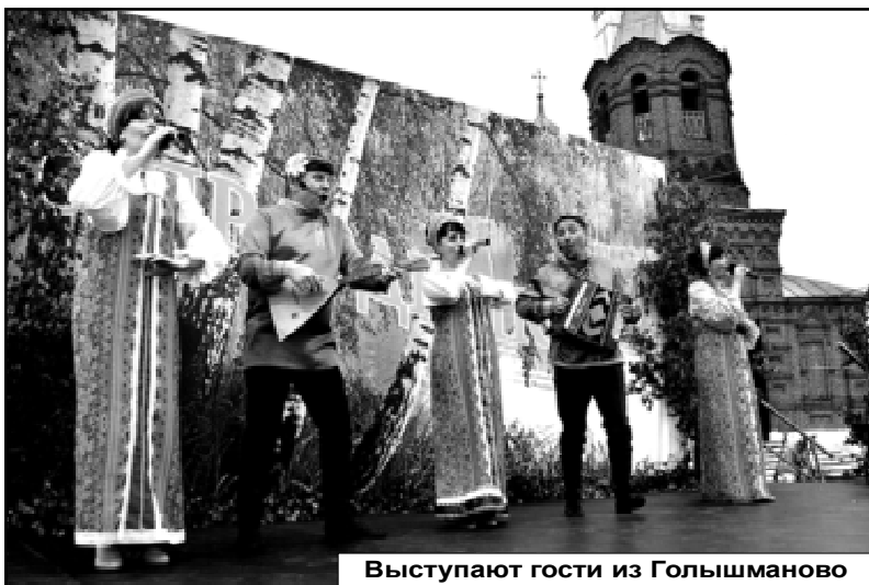
Выступают гости из Голышманово