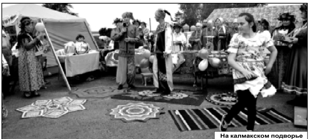
На калмакском подворье