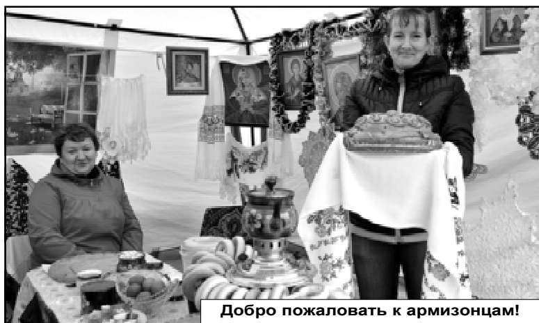
Добро пожаловать к армизонцам!