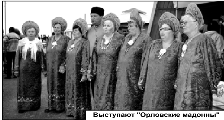
Выступают "Орловские мадонны"