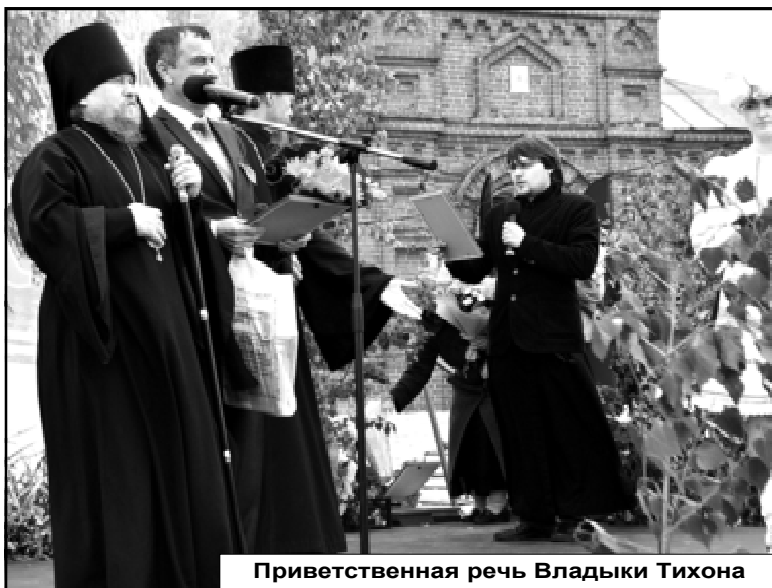
Приветственная речь Владыки Тихона