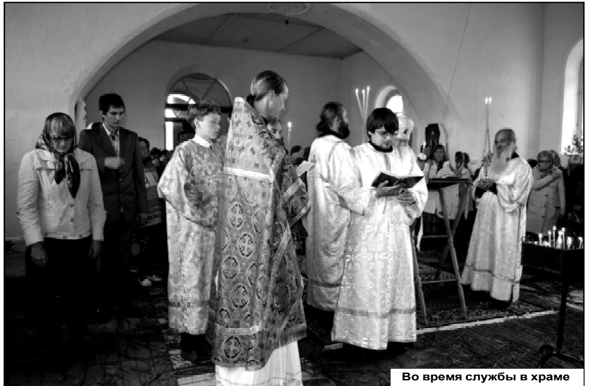
Во время службы в храме