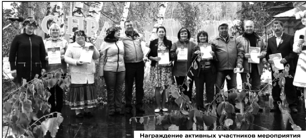
Награждение активных участников мероприятия