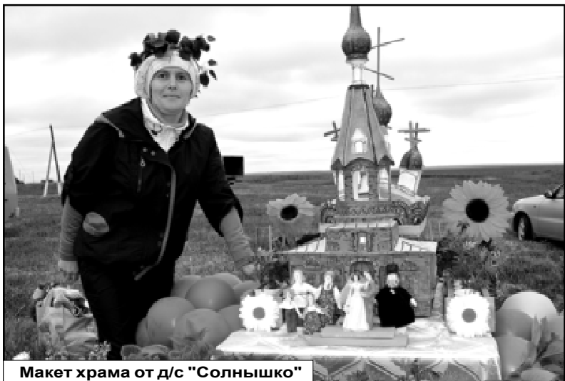
Макет храма от д/с "Солнышко"