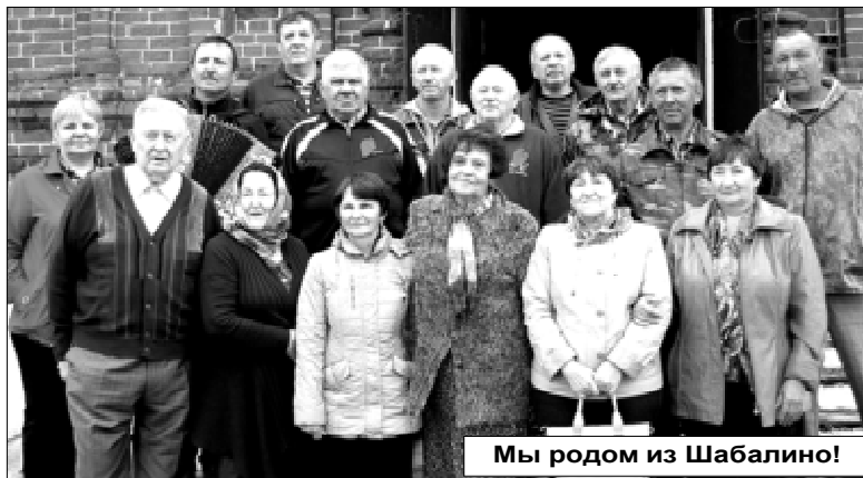
Мы родом из Шабалино!