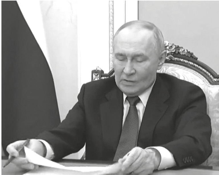
■ На снимке: Идёт совещание

Путин подчеркнул, что с недавнего времени для обработки обращений применяются отечественные решения в сфере искусственного интеллекта (ИИ) и благодаря новым