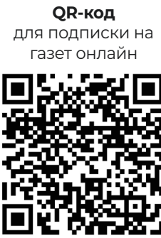
QR-код для подписки на газет онлайн

Таким образом, подготовка к севу-2026 идёт в плановом режиме. В Сорокинском округе основное внимание сосредоточено на проверке и корректировке семенного фонда, а в масштабах Тюменской области — на восстановлении и обслуживании сельхозтехники. Совместные усилия аграриев, специалистов и администрации создают прочную основу для успешного проведения посевной кампании. Всё это даёт уверенность, что предстоящий сев пройдёт организованно, а регион сможет рассчитывать на достойный урожай.