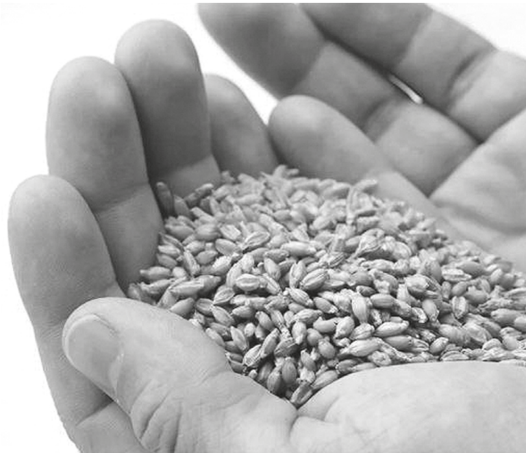
■ Подготовить кондиционные семена - задача важная