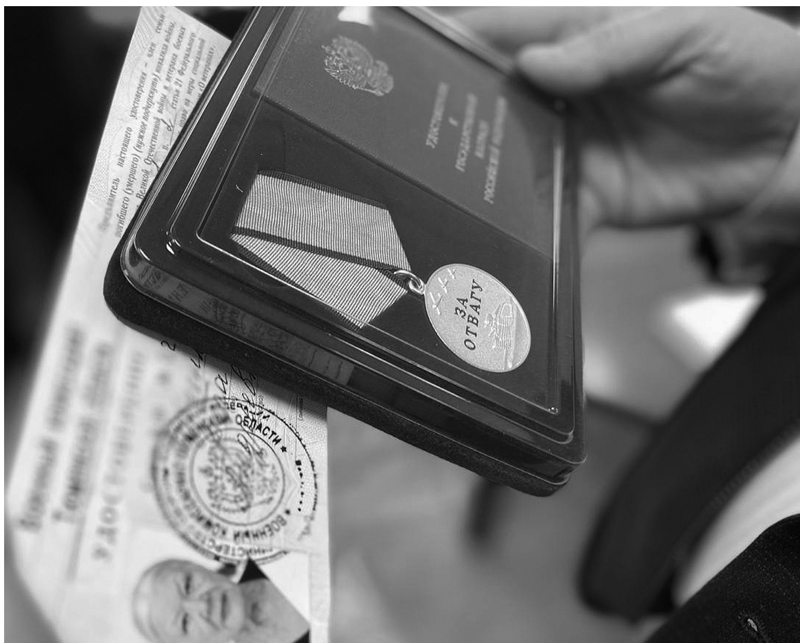
На снимке: Боец был награждён за проявленные мужество и самоотверженность при выполнении боевых задач

Главная тема. Посмертная награда вручена семье героя