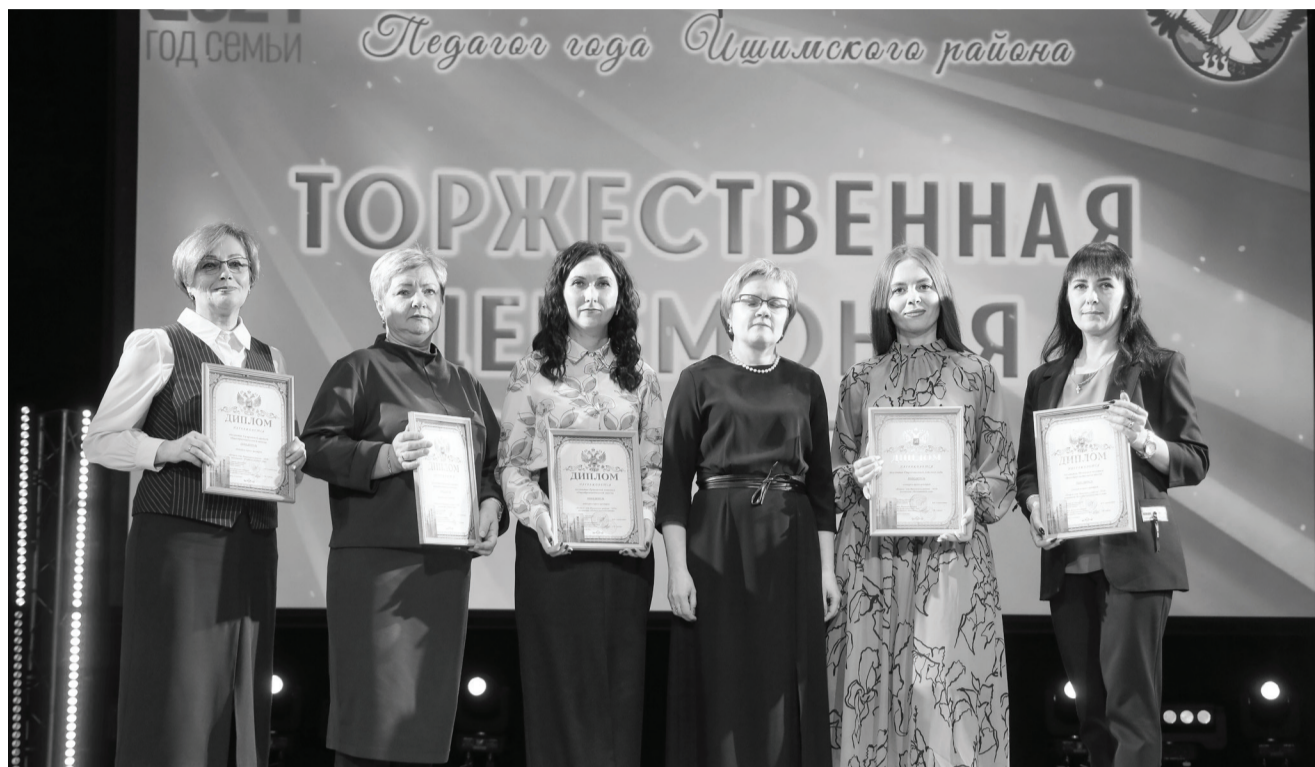
В школах Ишимского района работают настоящие профессионалы – люди, любящие детей и свою профессию, которые сами не перестают учиться.