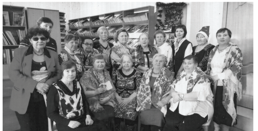
Участники клуба «Общение» всегда приходят в стены библиотеки с желанием узнать что-то новое, поделиться своим опытом и знаниями и просто пообщаться.

Клуб «Общение» при районной библиотеке создан в 2004 году. Это настоящий союз друзей, списочный состав клуба – 18 человек. Цель клуба – организация культурного досуга старшего поколения.