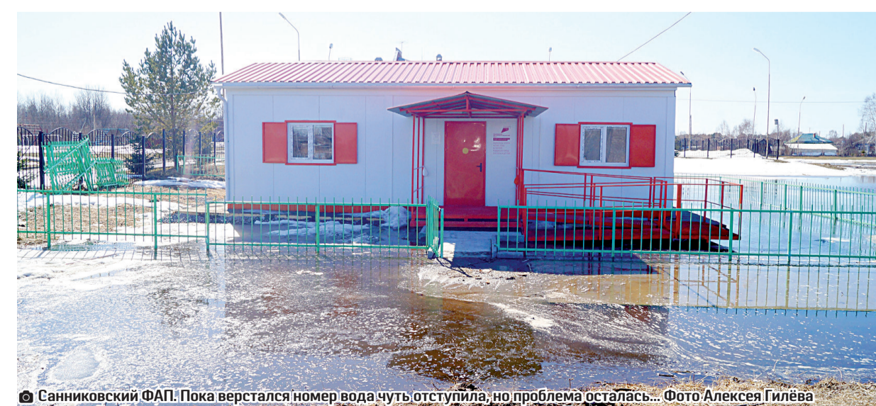
Санниковский ФАП. Пока верстался номер вода чуть отступила, но проблема осталась...