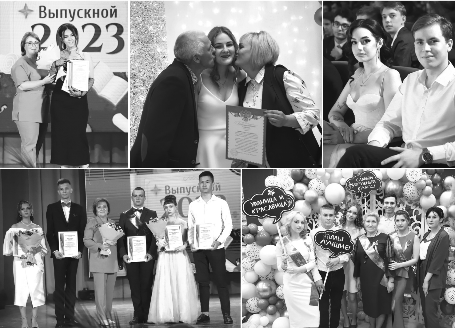
Выпускной вечер навсегда останется в сердце каждого вчерашнего школьника добрым и радостным воспоминанием

В этом учебном году из школ округа вышли в самостоятельную жизнь 129 старшеклассников