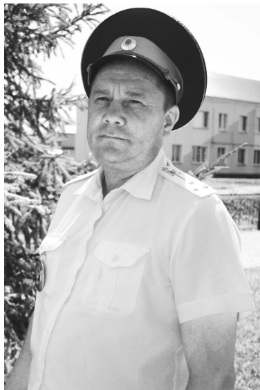
Работа инспектора ГИБДД непростая, из разряда – для настоящих мужчин

Многое поменялось за двадцать лет, особенно со стороны технического обеспечения. Есть планшеты, связь, доступ к базам прямо на дороге, непосредственно при патру-