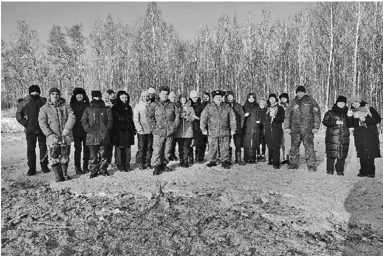
➤ Фото прислал автор

17 февраля – пятница, замечательный тёплый зимний день! Этот день наш 8 «А» класс ждал с нетерпением. Мы сегодня поехали в частные охотничьи угодья Викуловского района. Вот и закончились уроки! Все побежали в автобус. Отправляемся в путь в предвкушении новых неизгладимых впечатлений.