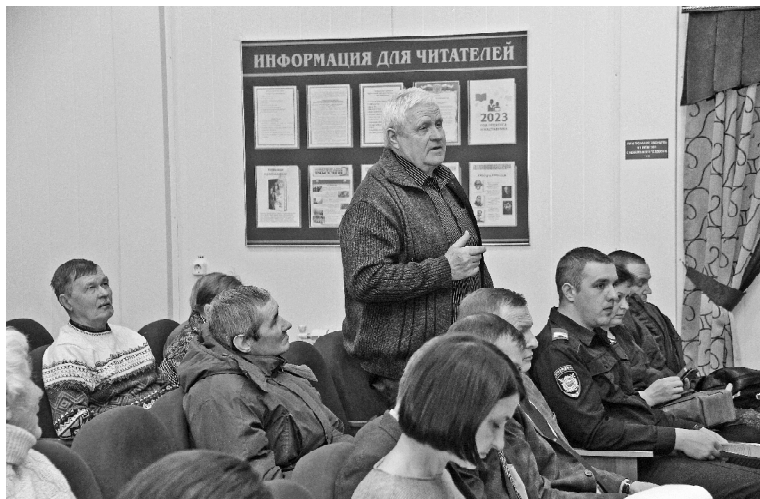
➤ Чуртанцы задают вопросы