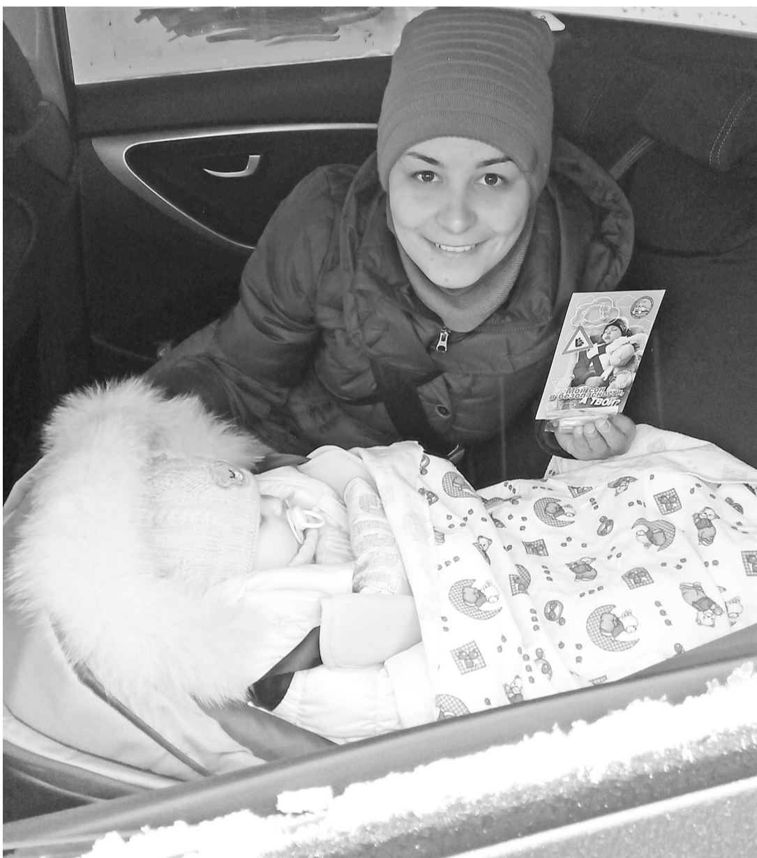
Хорошо, когда всё в порядке. Так должно быть всегда!