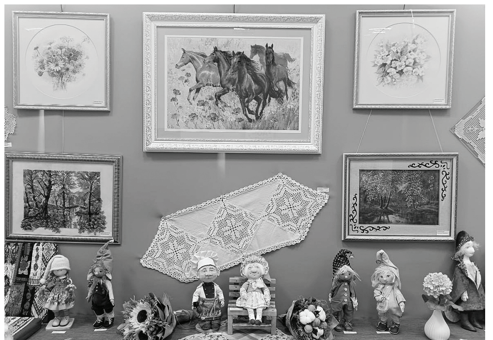
Как всегда богатой по видам рукоделия, технологиям изготовления работ, получилась выставка в Доме национальных культур и ремесел, в здании КЗ им. 30-летия ВЛКСМ. И красотой можно полюбоваться, и сувениры приобрести.

В обширную по программе встречу – со знакомством с технологией кар-