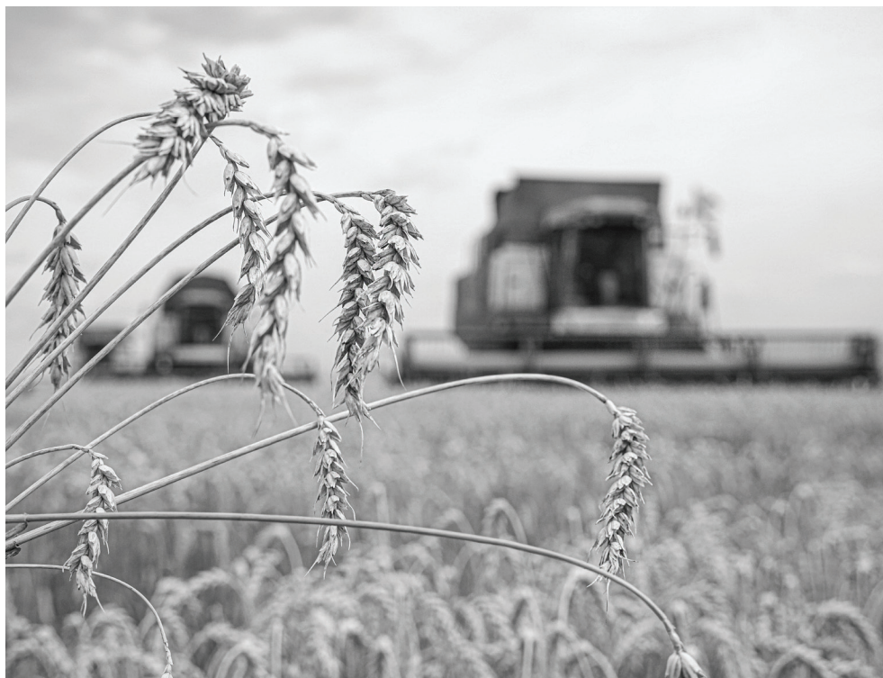
Агрохолдинг «Юбилейный» закончил уборочную кампанию.

В Викуловском и Абатском районах процесс шел куда напряженнее – истинная страда. Два подразделения – две причины. В ХРП «Абатское» это кадровый голод. Но не в чистом виде, а его последствия. Служба по персоналу агрохолдинга «Юбилейный» полностью