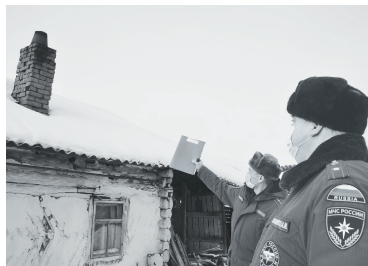
Сотрудники отделения надзорной деятельности проводят очередной рейд.

Подготовила Регина ГАПОНОВА.