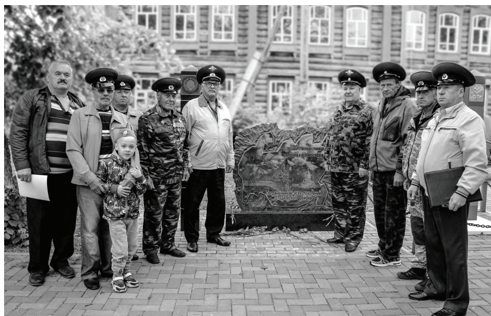
Ветераны провели традиционную встречу.

Ветераны-пограничники Сладковского района отметили праздничную и памятную даты