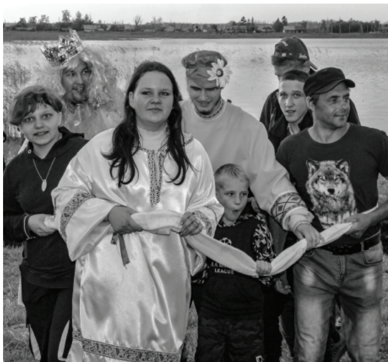
Старинный праздник был наполнен интересными моментами.