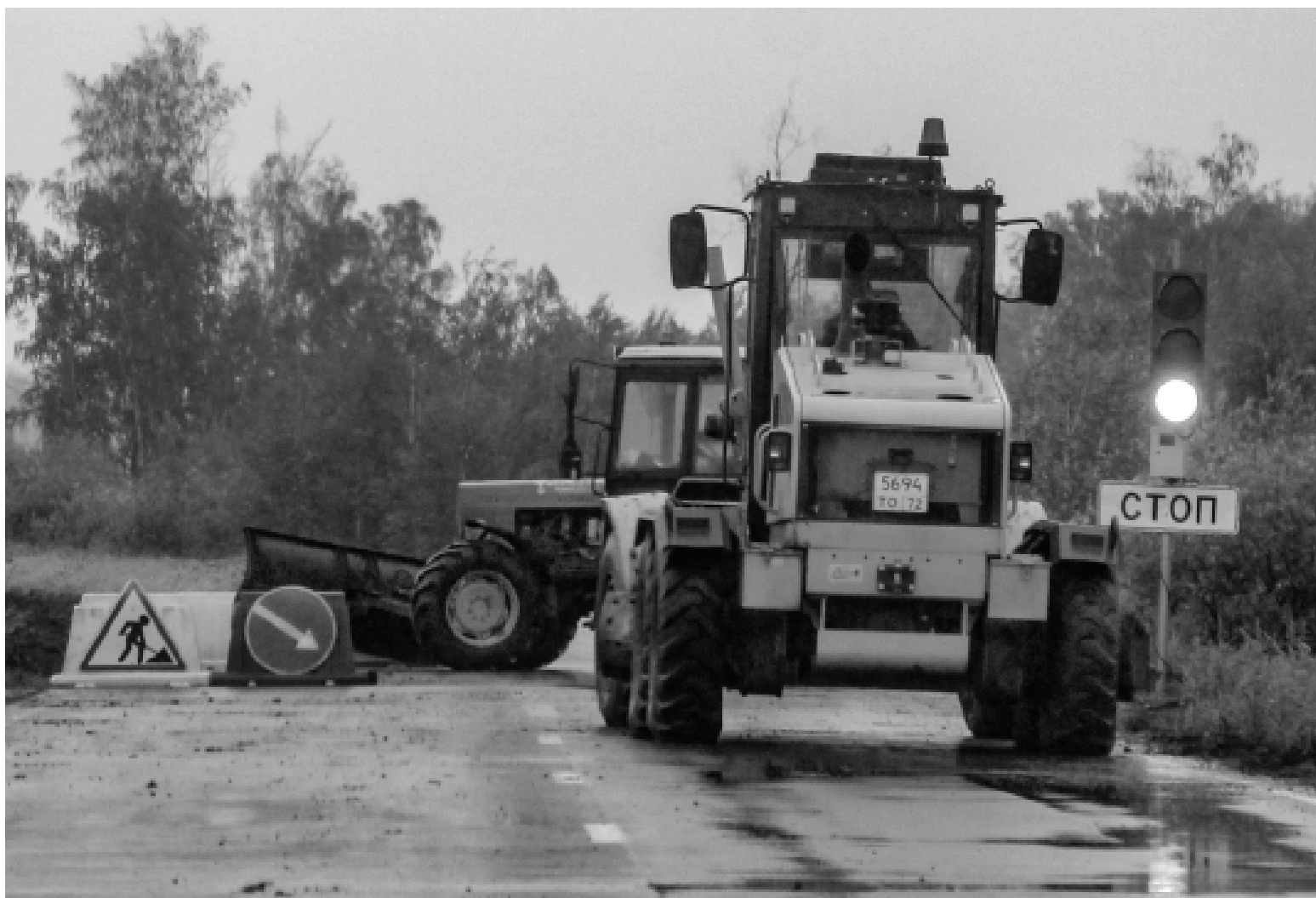
Специалисты и техника ДРСУ-5 справляются с поставленными на сезон задачами.

На двух дорожных объектах регионального значения ведутся ремонтно-строительные работы ДРСУ-5. Специалисты приводят в нормативное состояние почти десять километров дорог в Сладковском районе