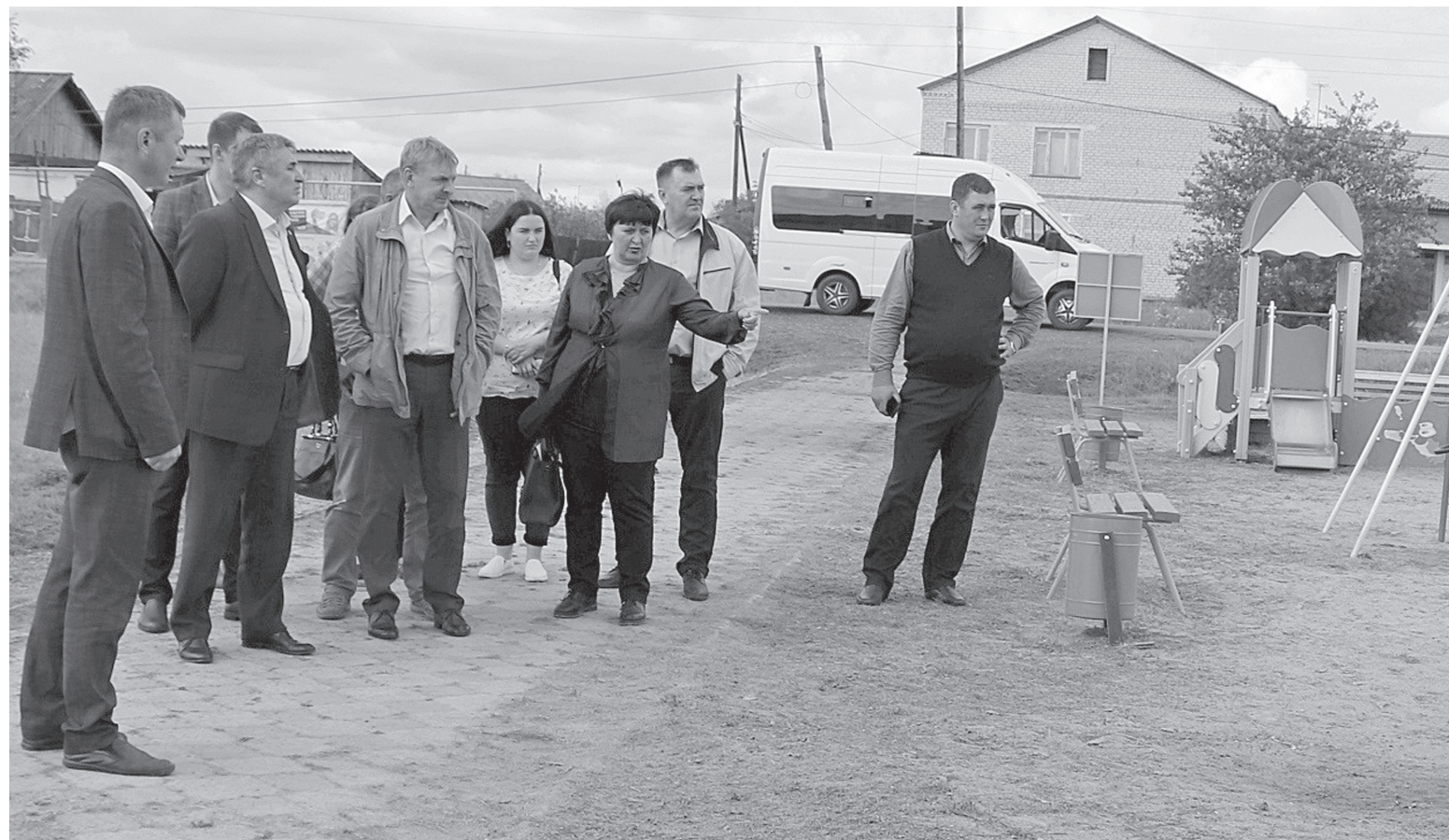
Опыт благоустройства сельских территорий.

– Благоустройство территории в удовлетворительном состоянии, но это, скорее, плохо, чем хорошо. Будем считать, что руководитель здесь ещё не достаточно опытен по сравнению со своими старшими коллегами. Работа ведётся в двух направлениях – озеленение и борьба с сорной раститель-