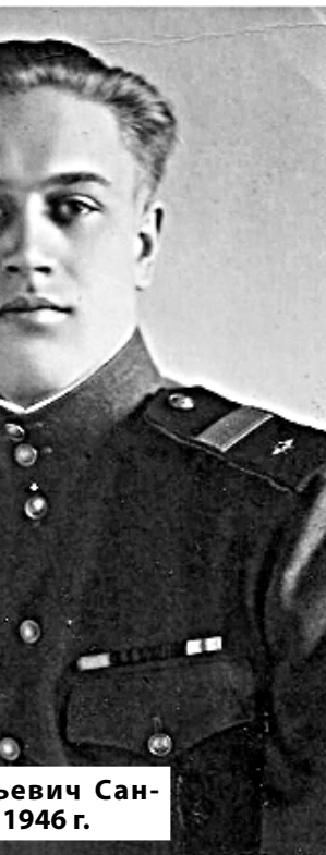
евич Сан- 1946 г.