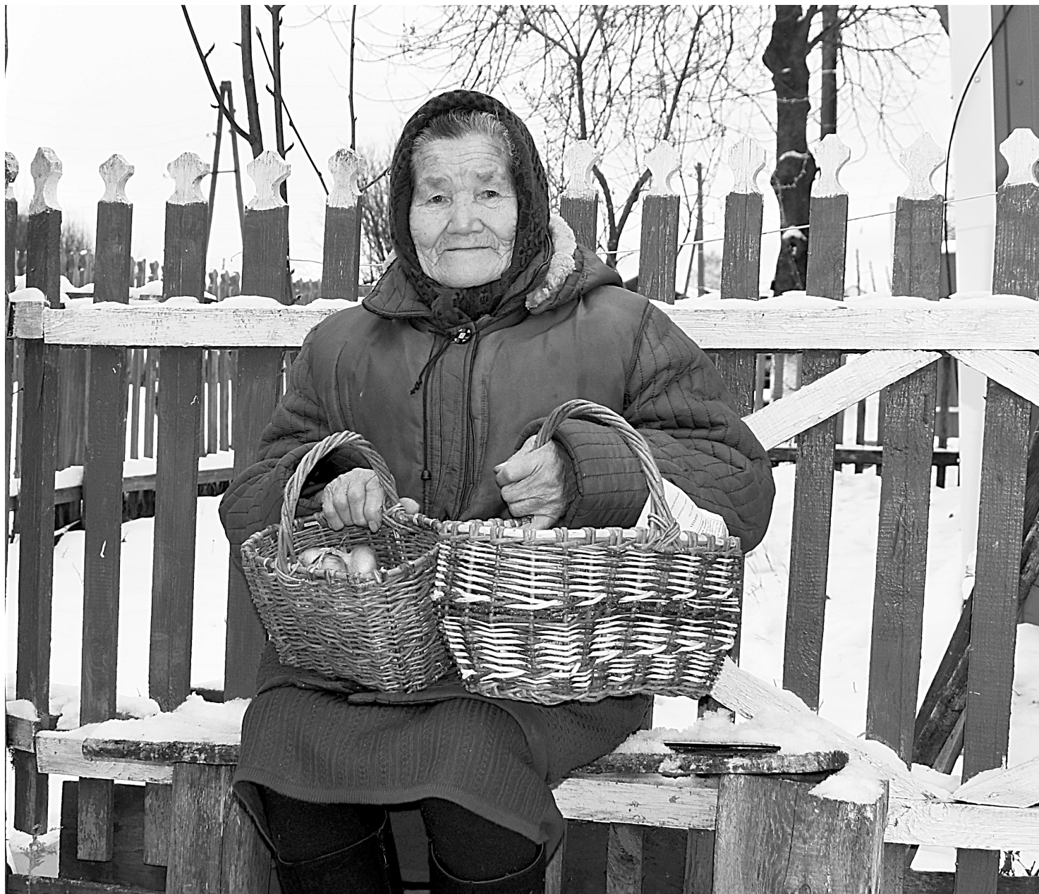
В таких корзиночках из лозы удобно хранить лук, чеснок или ходить в лес за грибами