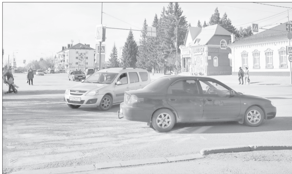
Инспекторы утверждают, что парковка мешает водителям, двигающимся по ул. Тюменской

После обсуждения участники совещания поручили представи-