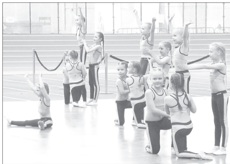
Ялуторовским малышам из чир-группы Charlie всего по 5-7 лет, но они произвели фурор и добились первого места

Как было в областной столице. Манеж на Луначарского, 12 открылся на три года позже «Атланта», и по площади он раза в три больше. Его трибуны вмещают 1526 человек, а наши – 300, но дело совсем не в этом. Везде волонтеры, и это не просто активная молодёжь, а действующие спортсмены. Все в одинаковых футболках и с бейджами. Впрочем, бахилы, которые предлагают на входе, стандартные. Они ровно так же протираются, рвутся или сползают с обуви, как и у нас. В зале с помощью большого углового баннера сделана мобильная выгородка – впереди выступают участники, позади готовятся следующие и работают добровольцы. Колонки стоят по углам площадки, слышимость вполне внятная, без эха. Чётко продуманы зонирование и маршрут: выступили, подошли на фотографирование, переместились к монитору на просмотр повтора. Прямую трансляцию в соцсетях ведут две камеры: одна общим планом с террасы второго этажа (он почти как в «Атланте»), за второй – оператор,