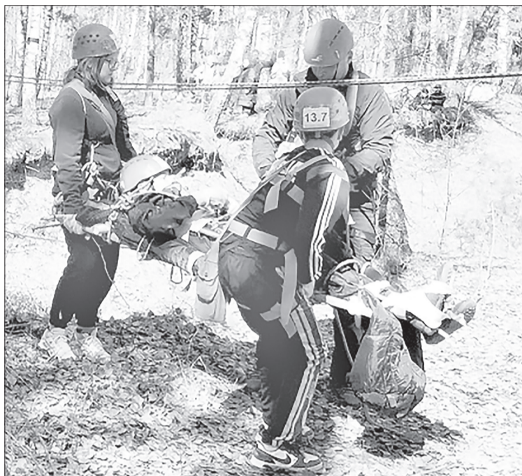
Дисциплины соревнований копируют основные действия спасателей при ЧС

■ СПРАВКА «ЯЖ». Команды, занявшие первые места, получили право участвовать в межрегиональных соревнованиях Уральского федерального округа в Екатеринбурге.